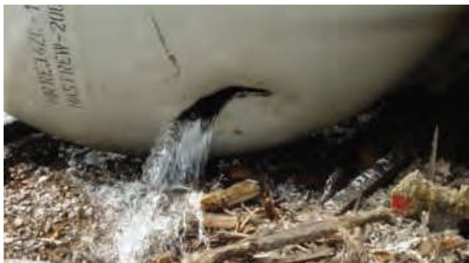
2. Negatywny wpływ katastrofy kolejowej na podtorze. Katastrofa w Szczygłowicach 23.05.2002 [10]

Wszystkie te materiały mają negatywny wpływ na podtorze i jego elementy, np. pod ich wpływem zmieniają się podstawowe właściwości geosyntetyków stosowanych w konstrukcjach podtorza (np. nasypy, wykopy) w zakresie ich przepuszczalności, wytrzymałości i odkształcenia. Powszechne wykorzystanie geosyntetyków do zbrojenia gruntu w podtorzu i związanych z nim konstrukcjach oporowych, czy wzmacnianie za pomocą geosyntetyków lokalnych kawern powoduje ich mobilizację na rozciąganie. W tych nowych warunkach zmienia się charakter współpracy grunt – geosyntetyk. Zmieniają się charakterystyki materiałowe wywołane wysokimi temperaturami i czynnikami chemicznymi, a dalej zmieniają się charakterystyki i parametry opisujące zachowanie się strefy kontaktowej. Są one inne niż przyjęte w projektowaniu lub badaniach teoretycznych zależności współpracy (grunt – geosyntetyk lub grunt – geosyntetyk – grunt itp.) i fakt ten należy uwzględnić przy remediacji [4].