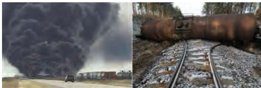
1. Katastrofy kolejowe: a) w kanadyjskiej prowincji Saskatchewan 7.10.2014; b) w Wydminach 2.01.2016.

piecznych o właściwościach utleniających, palnych, toksycznych itp. do otoczenia (wyciek podczas zderzenia – kolizji, wykolejenia, rozszczelnienia się cysterny podczas transportu itp.) może wystąpić ryzyko katastrofy ekologicznej.