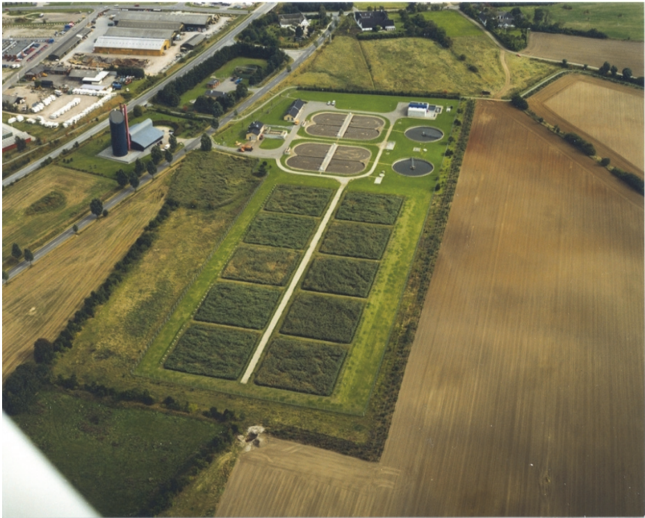
Rys. 4. Konwencjonalna oczyszczalnia ścieków z częścią osadową realizowaną w złożach trzcinowych,

System trzcinowy w Helsinge (rys. 4) odwadnia i stabilizuje nadmierny osad ściekowy pochodzący z konwencjonalnej oczyszczalni ścieków obsługującej 42 000 RLM (Równoważna Liczba Mieszkańców) i stabilizuje 630 ton suchej masy osadów w ciągu roku. System ten zajmuje powierzchnię wynoszącą 10 ha i jest złożony z 10 basenów trzcinowych. Jest eksploatowany od 1996 roku.