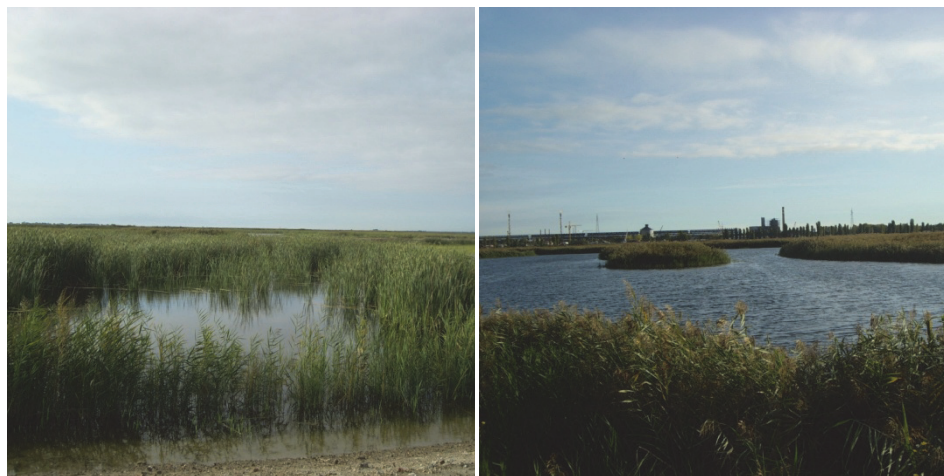
Rys. 3. System trzcinowy Fusina, foto M. Gajewska Fig. 3. Treatment wetland in Fusina, foto M. Gajewska

Tabela 1. Jakość ścieków na dopływie i odpływie w systemie hydrofitowym Fusina, (Kantawanichkul 2009)