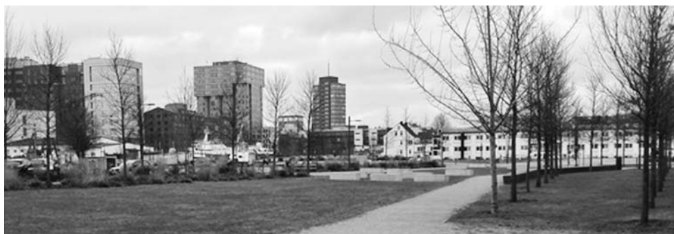
Fot 12: Harburg Binnenhafen widok od strony Schloßinsel na rejon dawnego Güterbahnhofs-gelände . W sylwecie czytelne są nowoczesne dominanty biurowców (od lewej) Keispeicher am Binnenhafen , Das Silo i Channel Tower

Binnenhafen mozaiki programów miejskich 27 . Rozwój metrozony postępuje sukcesywnie na podstawie ustaleń masterplanów sformułowanych na bazie konkursów urbanistycznych i wyników procesu konsultacyjno-negocjacyjnego. Program nowego zagospodarowania dawnego dworca towarowego Güterbahnhofs-gelände (konkurs 2000) 28 zakłada wprowadzenie zróżnicowanej typologii zabudowy mieszkaniowej, która z tematem pracy połączona została dzięki adaptacji i uzupełnieniom struktur dawnych magazynów na funkcje biurowe (fot. 12). Ich wizerunkową rolę podkreślono w sylwecie, w której czytelne są dominanty krajobrazowe trzech biurowców Channel Tower (2002), Keispeicher am Binnenhafen (2003) oraz Das Silo (2004) 29 – ikoniczny dawny silos zbożowy mieszczący dziś międzynarodowe centrum biznesu (fot. 13).