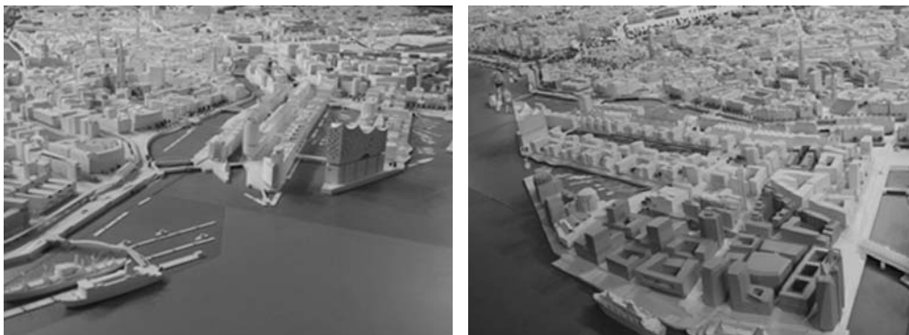
Fot. 2. Model założenia Speicherstadt i Hafencity

W sposób bezpośredni podjęto to wyzwanie w obszarze ukształtowanym przez rozwidlenie rzeki Łaby 17 , jako strategię ujętą w hasło Skok przez Łabę (niem. Sprung über die Elbe ). Podkreślić miało ono mentalne i fizyczne przełamanie granicy pomiędzy miastem a wyspą Wilhelmsburg wraz z sąsiadującymi z nią dzielnicami, takimi jak Harburg i Veddel (fot. 5). Chodziło też o wskazanie konieczności intelektualnego wybicia się poza dotychczasową praktykę zagospodarowywania przestrzeni. Przygotowania do powołania specjalnego instrumentu dla przekształceń tej istotnej wewnętrznej peryferii , zapoczątkowała w 2002 r. zainicjowana oddolnie debata środowiskowa nad przyszłością dzielnicy zatytułowana: Zukunftskonferenz: Insel im Fluß – Brücken in der Zukunft vorlegen ( Konferencja nad Przyszłością: Wyspa rzeczna – przerzucenie mosty ku przyszłości ) [Woitass, Ploucquet 2003]. Wynikające z niej postulaty (1) podniesienia standardów mieszkalnictwa dostępnego finansowo, (2) poprawy oferty edukacyjnej oraz (3) umożliwienia równych innym dzielnicom szans rozwojowych – w syntezie z aktualną wiedzą zaowocowały sformulowaniem trzech pól tematycznych, którym dedykowana miała być specjalna polityka w tym regionie. Były to (1) Pro-