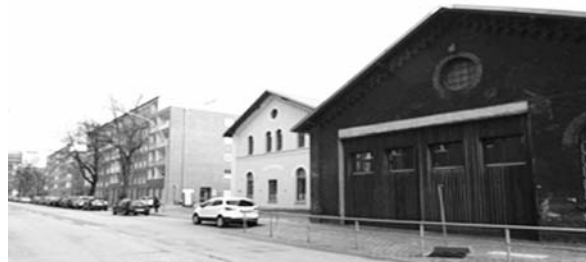
Fot 14: Hafencampus na terenach dawnego dworca towarowego w rejonie ulicy Schellerdamm