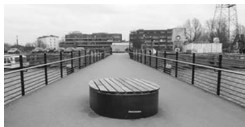
Fot. 18. Malowniczość krajobrazu i nowa estetyka przestrzeni publicznych nowego zagospodarowania nabrzeży Harburger Binnenhafen umacniają kulturę dnia codziennego