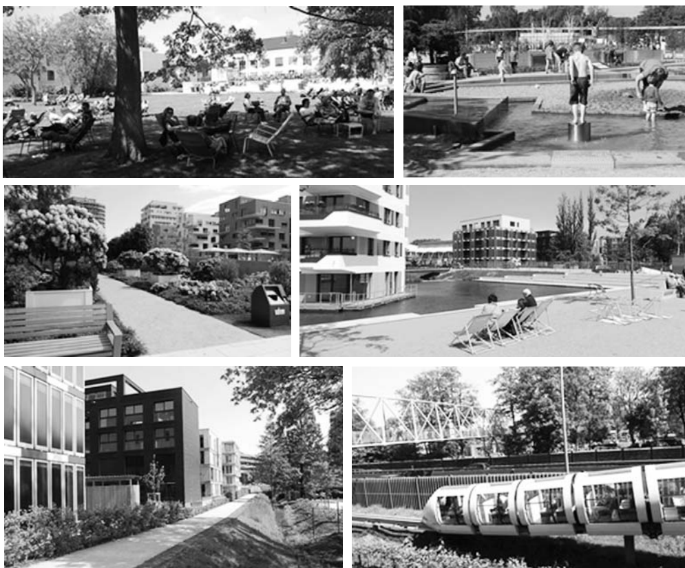
Fot. 8. Trwałe inwestycje w przestrzeń rekreacyjną i mieszkaniową w rejonie Wilhelmsburga związane z realizacją IGA Internationale Garten Ausstellung 2013, obecnie Wilhelmsburg Insel Park

Istotnie przyczynia się do tego infrastruktura transportowo-przesyłowa, zbudowana zgodnie z zapotrzebowaniem mijającej epoki technologicznej.