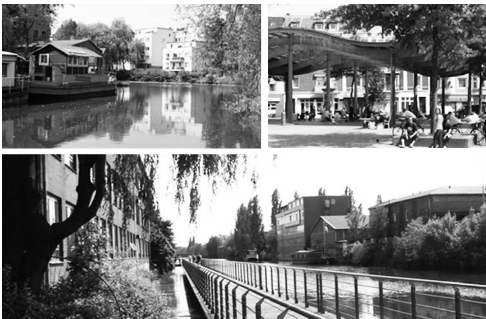
Fot. 7. Inwestycje w system przestrzeni publicznych poprawiających jakość życia w rejonie Wyspy Wilhelmsburg w okresie półmetka pracy IBA Hamburg (ok. 2009 r.)

pujące po niej wieloletnie zaniedbania, wymagające u progu XXI w. publicznych programów odnowy [Plagemann 2003].