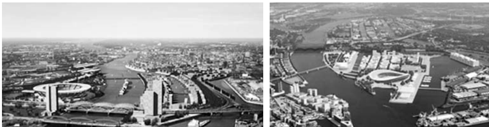
Fot. 1. Hamburg propozycja przygotowania miasta do igrzysk olimpijskich (główny stadion) w obszarze poportowym Kleiner Grasbrook (po lewej) koncepcja Olimpiada 2012; (po prawej) koncepcja Olimpiada 2024

Wzrost ekonomiczno-przestrzenny u końca XX w. wymógł na władzach Hamburga – miasta i państwa związkowego – podjęcie działań na rzecz nowego ukierunkowania polityki, zapewniającego zbudowanie silniejszej pozycji wobec rynków globalnych [Egert 2003]. Odpowiedzią na nie stała się strategia budowania wizerunku Wrastającego Miasta (niem. Wachsende Stadt ), atrakcyjnego na równi dla obecnych, jak i nowo przybywających mieszkańców i podmiotów gospodarczych. Poważnie potraktowano w niej myśl Manuela Castells'a wskazującą na konieczność przeciwdziałania skutkom globalizacji, ujawniającej się w coraz silniejszym rozchodzeniu się wirtualnej i rzeczywistej sfery funkcjonowania społeczeństw [Walter 2003]. Poszukiwanie adekwatnych dla rozwoju metropolii jakości, związane ściśle z podniesieniem innowacyjności i wzrostem skuteczności aktywnej polityki prointe-