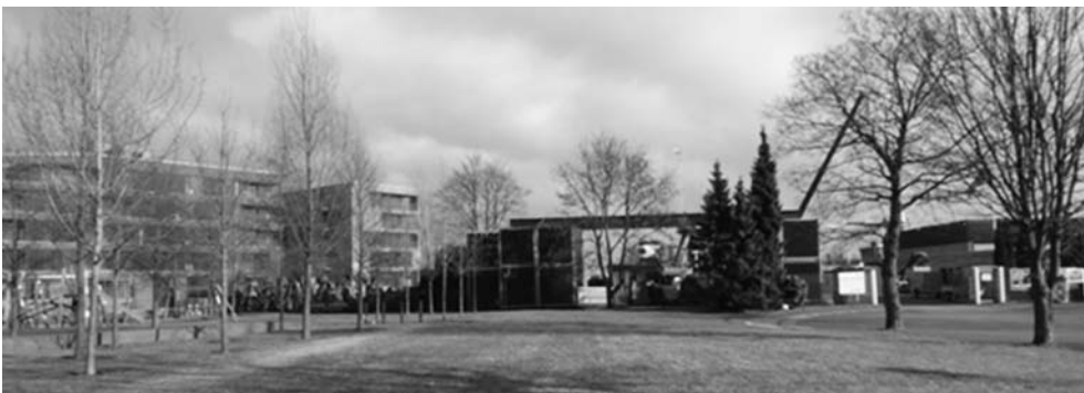
Fot. 16. Zespół Schlossinsel Marina . Luksusowa architektura w modelu Boat House sąsiaduje z pozostałościami funkcji portowych, otwierając się na alternatywną malowniczość krajobrazu metrozony

nowemu ukształtowaniu obszaru Schloss Insel , obejmującego pozostałości dawnej twierdzy Horeburg . Głównym atraktorem tej lokalizacji stała się możliwość połączenia budynków mieszkaniowych z funkcją przystani wodnej w modelu tzw. Boat House . Jest to rozwiązanie umożliwiające bezpośredni dostęp do budynku mieszkalnego łodziom, jachtom i motorówkom, połączony z funkcją ich całorocznego zadanego parkowania. Akwen przystani jest spójną częścią ogólnego systemu kanałów