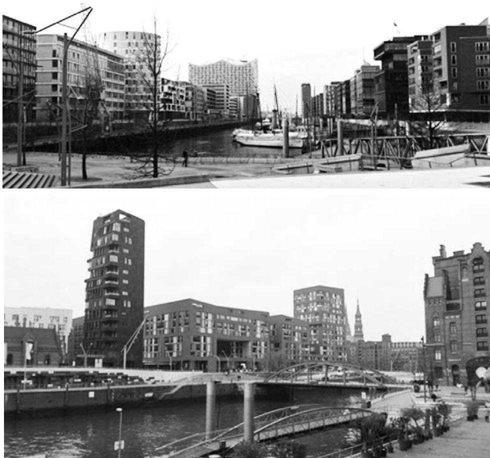
Fot. 3. Główne przestrzenie publiczne założenia Hafencity w rejonie Magellan Terrassen (zdjęcie górne) i Magdeburger Hafen (zdjęcie dolne)

duktywne kształtowanie (wykorzystanie) globalizacji (niem. Globalisierung produktiv gestalten! ), (2) Korzystanie z kultury i wiedzy jako zasobów budujących wartości (niem. Ressourcen aus Wissen und Kultur wertschöpfend nutzen! ) oraz (3) Stworzenie pełnowartościowych miejskich założeń mieszkaniowych (niem. Qualitätvolle städtische Quartiere schaffen! ) 18 [Walter 2007]. Zrealizowana w latach 2006-2013 IBA Hamburg miała przynieść odpowiedzi połączone mottem Przyszłość Metropolii (niem. Zukunft der Metropole ), których poszukiwano w ramach trzech bloków tematycznych Kosmopolis , Metrozony oraz Zmiana Klimatu 19 . Taka formuła nawiązywała do doświadczenia