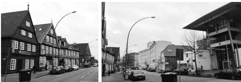
Fot. 11. Schloßstraße historyczne budynki mieszczące szkołę muzyczną, drobne usługi i gastronomię, po prawej nowoczesne centrum innowacji i przedsiębiorczości TUTECH

Binnenhafen mozaiki programów miejskich 27 . Rozwój metrozony postępuje sukcesywnie na podstawie ustaleń masterplanów sformułowanych na bazie konkursów urbanistycznych i wyników procesu konsultacyjno-negocjacyjnego. Program nowego zagospodarowania dawnego dworca towarowego Güterbahnhofs-gelände (konkurs 2000) 28 zakłada wprowadzenie zróżnicowanej typologii zabudowy mieszkaniowej, która z tematem pracy połączona została dzięki adaptacji i uzupełnieniom struktur dawnych magazynów na funkcje biurowe (fot. 12). Ich wizerunkową rolę podkreślono w sylwecie, w której czytelne są dominanty krajobrazowe trzech biurowców Channel Tower (2002), Keispeicher am Binnenhafen (2003) oraz Das Silo (2004) 29 – ikoniczny dawny silos zbożowy mieszczący dziś międzynarodowe centrum biznesu (fot. 13).