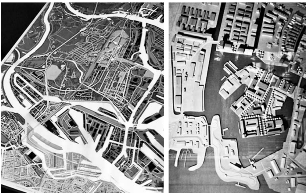
Fot. 5. (po lewej) Model rejonu objętego IBA Hamburg Wilhelmsburg na tle układu kanałów portowych i odnóg rzeki Łaby, (model w IBA DOCK 2007 r.), (po prawej) model założeń planowanego ukształtowania nowej struktury portu śródlądowego Harburger Binnenhafen w rejonie Schloßinsel