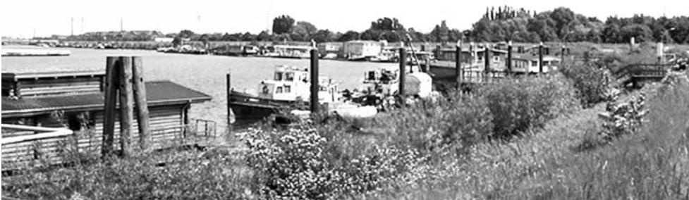
Fot. 6. Krajobraz Wyspy Wilhelmsburg na styku obszarów portowych i miejskich w okresie półmetka pracy IBA Hamburg (ok. 2009 r.) Na górnym zdjęciu w oddali widać wieżę barokowego kościoła św. Michała – symbolicznej ikony historycznego Hamburga

i świadkiem codziennych, międzykulturowych konfliktów społecznych 21 . Ich silną podbudowę stanowiły skutki tragicznych wydarzeń powodzi z 1962 r. 22 oraz nastę-