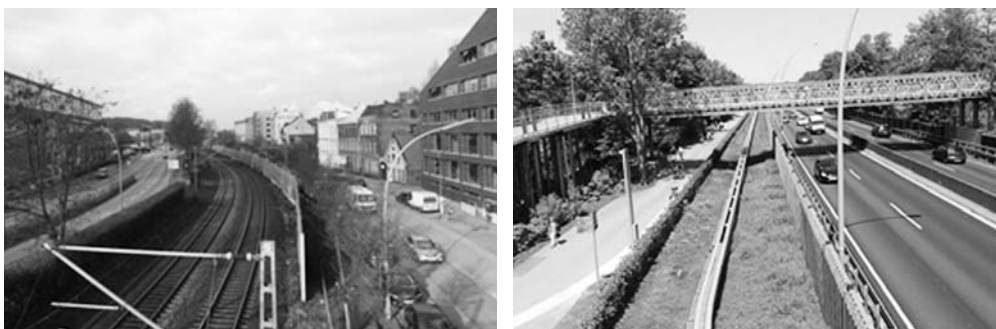
Fot. 10. Główne problemy przestrzennie zintegrowanego rozwoju metrozone na przykładzie rejonu IBA Hamburg: rdzeń komunikacyjny dla obsługi Harburger Binnenhafen w rejonie ulicy Karnapp; widok z kładki pieszej przy biurowcu Channel Tower (po lewej), Wihelmsburger Reichstraße przecinającej Wyspę i tereny IGA 2013 widok na tymczasowa pieszą kładką z wagonu monorail (po prawej)

innowacji oraz nowymi programami biurowo-mieszkaniowymi, zachowując cenne wyważenie skali i ziarnistości tkanki przeniesione do nowych realizacji (fot. 11). Wyodrębniający się architektonicznie budynek TUTECH 24 jest istotną dla realizacji strategii rozwoju metrozone placówką mieszczącą wspólne przedsięwzięcie gospodarcze Technischen Universität Hamburg i miasta Hamburg wspomaganym przez Hamburg Innovation. Jego celem jest łączenie działających w ramach metropolii Hamburga uczelni wyższych oraz instytucji naukowo-badawczych z prywatnym sektorem przedsiębiorczości. Jednym z wyznaczników jego potencjału jest stowarzyszenie channel hamburg e.V. 25 zrzeszające podmioty gospodarcze działające w Harburger Binnenhafen . Firmuje ono najnowsze przedsięwzięcie tej wzrastającej dzielnicy Hamburg Innovation Port 26 dedykowane rozwojowi technologii cyfrowych. Jego otwarcie na Ziegelwiessenkanal w połowie 2019 r.