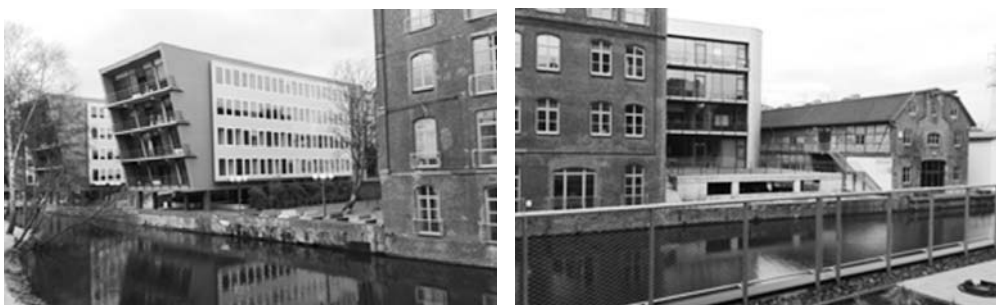
Fot. 13. Obiekty biurowe – nowe budynki i adaptowane lofty po obu stronach Westlicher Bahnhofskanal