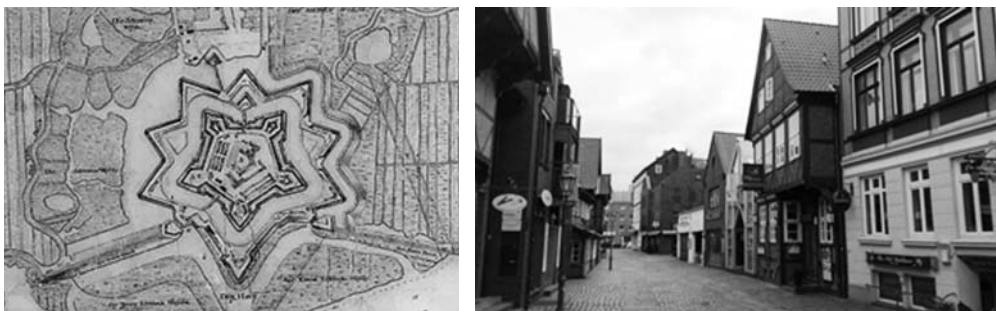
Fot. 9. Plan historyczny ufortyfikowanego Harburga (po lewej) oraz ostańce historycznej zabudowy w centrum miasta (po prawej)

Harburg jest siedzibą uniwersytetu technicznego (TUHH) 23 , który zgodnie z założeniami strategicznymi, stanowić ma istotne ogniwo rozwoju tej części metropolii. Był aktywnym, instytucjonalnym partnerem współtworzącym innowacje w ramach IBA, a jednocześnie odbiorcą generowanych przez nią programów wzmocnienia innowacyjnej przedsiębiorczości oraz programów mieszkaniowych. Ośmiotysięczna społeczność akademicka stała się też adresatem rozwiązań łączących kwestię mieszkalnictwa dostępnego i pracy w rejonie restrukturyzowanego portu śródlądowego. Krajobraz Schloßstraße – głównej ulicy Harburger Binnenhafen , ujawnia pełną złożoność problematyki przekształceń w metrozonach . Ostańce przeszłości, sąsiadują z centrum