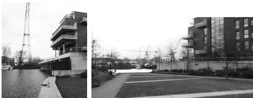
Fot. 17. Realacja budynku mieszkalnego w modelu Boat House w zespole Quartier am Park z elementami infrastruktury technicznej – sieci energetycznej i parkowo ukształtowanych zabezpieczeń przeciwpowodziowych