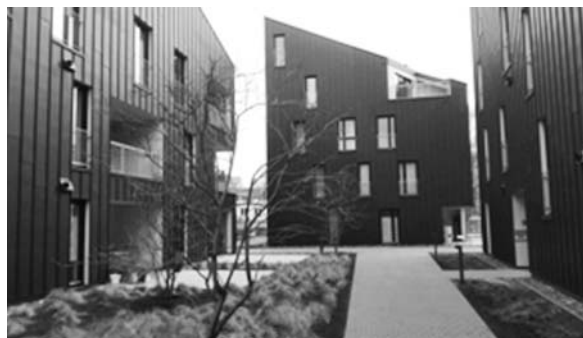
Fot. 15. Zespół zabudowy mieszkaniowej przy Kaufhaus Kanale