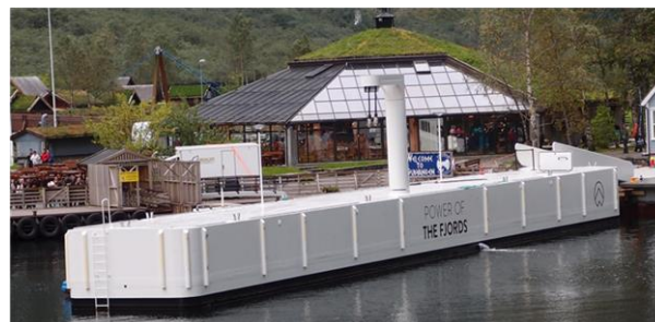
Rys. 7. Morska stacja dokująca dla promu „Future of the Fjords”.

siębiorstwa The Fjords, a należące do Norweskiego Ministerstwa Ropy Naftowej i Energii, przedsiębiorstwo Enova, pozyskało 2,1 miliona USD na wsparcie budowy tego statku.