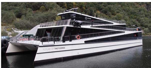
Rys. 6. Elektryczny prom pasażerski „Future of the Fjords”

Prom „Vision of the Fjords” stał się prototypem dla w pełni elektrycznego promu „Future of the Fjords” (rys. 6), zbudowanego również przez stocznię Brødrene w 2018 roku. Zachowany został kształt promu, natomiast kadłub i nadbudówka zostały zbudowane z laminatów warstwowych z cienkiego włókna węglowego, w celu zmniejszenia wagi o 50%. Prom „Future of the Fjords” jest pierwszym w pełni elektrycznym statkiem, pływającym po akwenach objętych ochroną UNESCO. Jest cichy, nie generuje wibracji i nie emituje żadnych zanieczyszczeń (tab. 4).