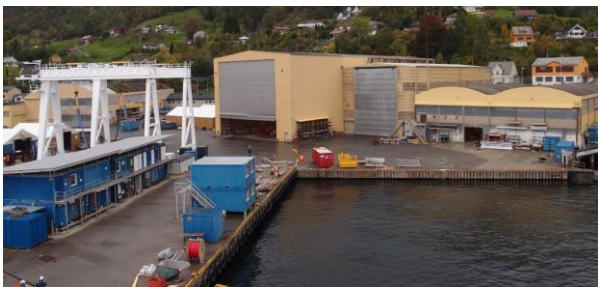
Rys. 1. Widok stoczni Fjellstrand AS

Stocznia zatrudnia około 100 pracowników i zmienną liczbę podwykonawców, w dużej części z Polski. Obiekty stoczni to około 7.000 m 2 ogrzewanych hal produkcyjnych, z zadaszoną powierzchnią magazynową o wielkości ok. 1.100 m 2 . Fjellstrand koncentruje się na byciu liderem w dziedzinie odnawialnych technologii morskich i zyskało międzynarodowe uznanie za swoją pracę, będąc nominowanym do nagrody „Offshore Renewables Award 2014” i zdobywając tytuł „Ship of the year 2014” promem elektrycznym „ZeroCat”.