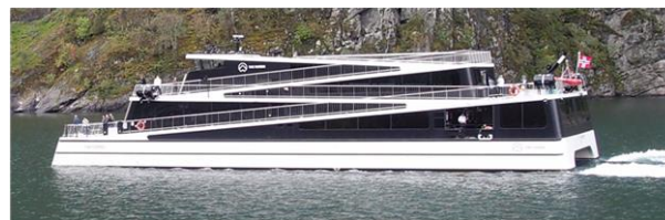
Rys. 5. Hybrydowy prom pasażerski „Vision of the Fjords”

Obie jednostki są nowocześnie zaprojektowanymi katamaranami, o długości 40 m i szerokości 15 m, wykonanymi z lekkich materiałów kompozytowych z włókna węglowego. Kształt promu został zainspirowany szlakiem na stromym zboczu góry (rys. 5), którego odzwierciedleniem są ścieżki spacerowe na wyższe pokłady (pasażerowie mogą okrążyć około 80% zewnętrznej części statku i podziwiać przepiękne widoki fiordów). Konstrukcja promu umożliwia podziwianie atrakcji turystycznych niezależnie od pogody – na najwyższym pokładzie lub w przestronnych i komfortowych wnętrzach inspirowanych stylem nordyckim z dużymi panoramicznymi oknami. Każdy z promów może przewozić 400 turystów na dwóch pokładach.