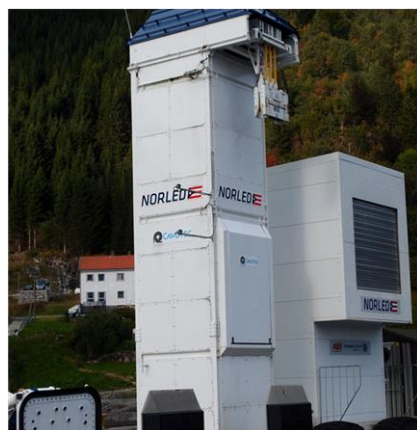
Rys. 3. Dwa systemy ładowania nabrzeżnego promu „Ampere”

Czas dostępny na ładowanie akumulatorów, podczas postoju promu to zaledwie 10 minut. Poziom niezbędnej mocy elektrycznej znacznie przekracza możliwości sieci energetycznej w wioskach Lavik i Oppedal, dlatego zainstalowano buforowe akumulatory w obu portach. Mogą być one ładowane z sieci w sposób ciągły z mocą 250 kW zapewniając następnie szybkie przekazanie energii do akumulatorów promu. Podczas postoju w nocy, prom ma do dyspozycji siedem godzin na naładowanie akumulatorów.