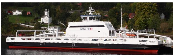
Rys. 2. Elektryczny prom „Ampere”

Norled – jeden z największych przewoźników promowych w Norwegii, posiadający flotę ponad 80 promów – wygrał konkurs ogłoszony przez norweskie Ministerstwo Transportu w 2011 roku na przyjazny środowisku prom pasażersko-samochodowy, przeznaczony do obsługi relacji Lavik – Oppedal w fiordzie Sognefjord. Zaproponowana jednostka „ZeroCat 120”, której nazwa została później zmieniona na „Ampere” (rys. 2), to całkowicie elektryczny prom, który czerpie energię wyłącznie z akumulatorów ładowanych z lądowej sieci energetycznej podczas postoju (tab. 1).