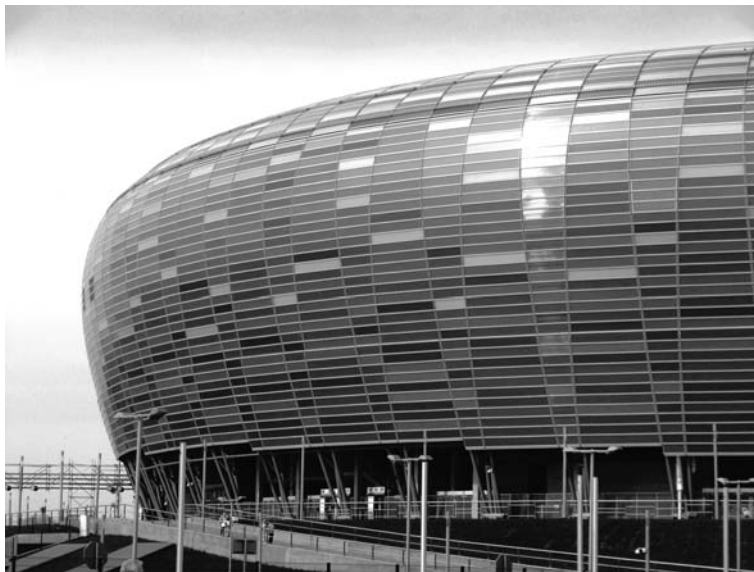
Fot. 2. Lśniąca w słońcu fasada stadionu PGE Arena

Gdańsk nie było zadaniem łatwym. Jak pisał Rasmussen: Trudność polega na tym, że dzieło architektoniczne powinno przetrwać aż w odległą przyszłość. Architekt tworzy scenografię dla długiej powoli toczącej się akcji, musi więc ona być na tyle elastyczna, by dostosować się do nieprzewidzianych improwizacji. Na etapie projektowania budynek powinien w miarę możliwości wyprzedzać swój czas, by pasował do okresu, na jaki przypadnie jego życie [Rasmussen 1999]. W przypadku budynków tak zaawansowanych technicznie i tak bardzo wpisanych we współczesny konsumpcyjny tryb życia, jak obiekty widowiskowo-sportowe tworzenie rozwiązań nowoczesnych, będących odpowiedzią na potrzeby dzisiejszego świata jest szczególnie istotne. Mało kto się zastanawia, z którymi wytworami naszej architektury społeczeństwo za sto lub dwieście lat będzie mogło nawiązać dialog. Wartością prawdziwej architektury jest bowiem to, że „żyje i mówi”. Każde pokolenie szuka swojego samookreślenia w symbolach; architektura jest takim symbolem, gdyż charakteryzuje zbiorowość twórczą i estetyczną. Potrzebujemy tego by nie stać się „pokoleniem bezbarwnym [L. Taraszkiewicz 2002].