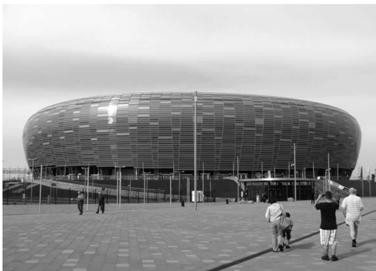
Fot. 1. Stadion Energa Arena

Fot. K. Taraszkiewicz, Gdańsk 2013 (fot. 1-3).