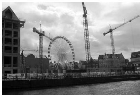
Fot. 4. Koło widokowe AmberSky na Wyspie Spichrzów stojące w pobliżu placu budowy nowych kamienic (2017)