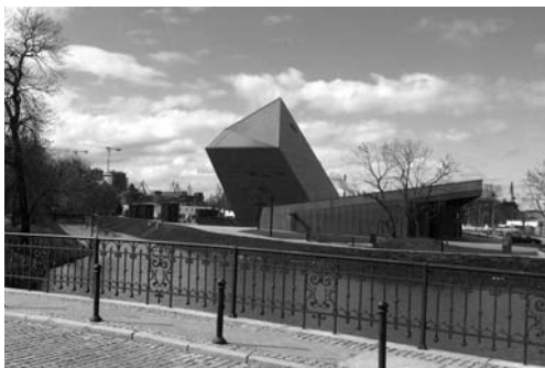
Fot. 1. Widok na Muzeum II Wojny Światowej Fot: D. Wojtowicz-Jankowska (fot. 1-4).

Innym elementem podnoszącym atrakcyjność miasta jest koło widokowe AmberSky (2013). Od momentu decyzji o jego pojawieniu się w mieście jest ono ustawiane w różnych miejscach, takich jak Targ Węglowy, Wyspa Spichrzów a obecnie Ołowianka. Nowe lokalizacje pozwalają nie tylko na obserwację miasta z różnych punktów widoko-