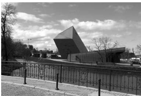
Fot. 1. Widok na Muzeum II Wojny Światowej

Innym elementem podnoszącym atrakcyjność miasta jest koło widokowe AmberSky (2013). Od momentu decyzji o jego pojawieniu się w mieście jest ono ustawiane w różnych miejscach, takich jak Targ Węglowy, Wyspa Spichrzów a obecnie Ołowianka. Nowe lokalizacje pozwalają nie tylko na obserwację miasta z różnych punktów widoko-