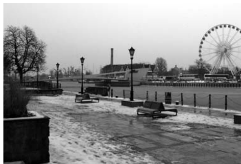
Fot. 2. Widok z Targu Rybnego na kładkę prowadzącą na Wyspę Ołowianka, forma przestrzenna „Gdańsk” i koło widokowe AmberSky