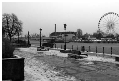
Fot. 2. Widok z Targu Rybnego na kładkę prowadzącą na Wyspę Ołowianka, forma przestrzenna „Gdańsk” i koło widokowe AmberSky