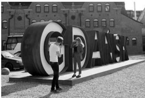
Fot. 3. Forma przestrzenna „Gdańsk” jako przykład wykorzystania narzędzi związanych z kształtowaniem marki

Programy zmierzające do poprawy przestrzeni miejskiej i uczynienia ją atrakcyjną dla mieszkańców i turystów są również przedmiotem aktywności ruchów miejskich [Popieralski, Mrozek 2015]. Dzielnice, które ocalały przed niszczącymi działaniami wojennymi i nie zostały poddane zmianom w okresie powojennym, oferują niezwykle klimat wynikający m.in. z zachowanego układu urbanistycznego. Archi-