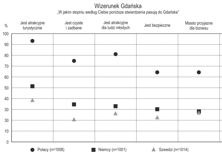
Ryc. 1. Ocena elementów składających się na wizerunku Gdańska, przez wybranych interesariuszy. Wyciąg z badania opinii publicznej dotyczące marki Gdańsk w 2013 r.

Tak jak to już zostało zaakcentowano we wprowadzeniu opracowania, na wizerunek miasta składa się wieloaspektowa, wielokrotnie subiektywna ocena odbiorców, która może podlegać badaniom statystycznym. Oceniane mogą być różne elementy wpływające na wizerunek miasta zależne od tego do kogo są one kierowane, jak np. atrakcyjność turystyczna, atrakcyjność dla ludzi młodych i dla przedstawicieli biznesu, bezpieczeństwo, czystość miasta (ryc. 1), ale także atrakcyjność względem innych miast (ryc. 2). Przedstawione przykłady wizualizują różnice w opiniach w zależności