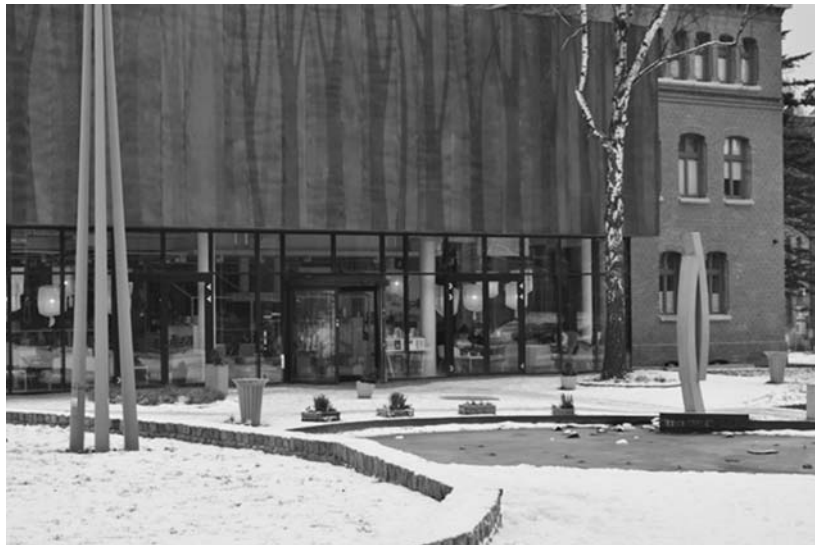
Fot. 4. Garnizon w Gdańsku Wrzeszczu - fragment zagospodarowanego terenu przed budynkiem „Sztuki Wyboru”