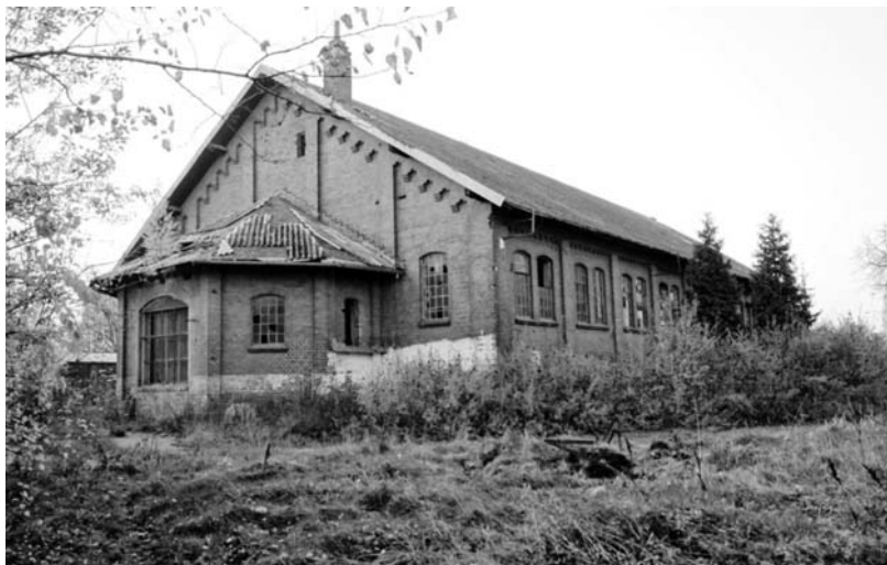
Fot. 1. Garnizon w Gdańsku Wrzeszczu – budynek dawnej ujeżdżalni koni, stan z 2008 r.

Do historii nawiązano również przez odsłonięcie na pewnym odcinku (wydobycie na powierzchni) ciekłu wodnego – Potoku Strzyża. Przestrzeń publiczna