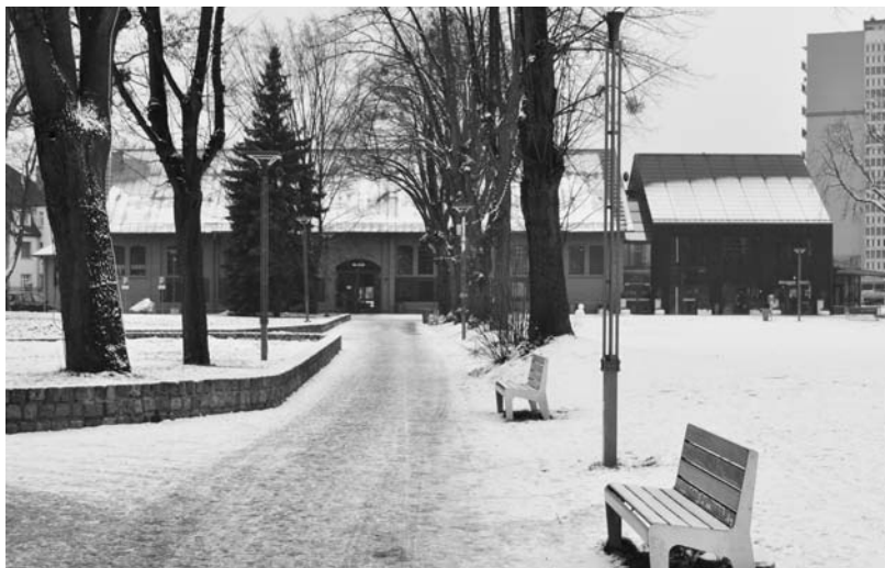
Fot. 3. Garnizon w Gdańsku Wrzeszczu – fragment zagospodarowanego terenu z ciągiem pieszym Fot. M. Kwasek, 2018.

Rewitalizacja tego terenu wpłynęła w dużym stopniu na funkcjonowanie reszty miasta. Dotąd niewykorzystywany obszar, stał się jednym z najczęściej odwiedzanych miejsc. Głównym czynnikiem skupiającym odbiorców, jest jego wielofunkcyjność połączona z walorami estetycznymi. Nagromadzenie zielonych obszarów rekreacyjnych w środku codziennego zgiełku zapewnia oddech. Dodatkowo przeplatające się ze współczesną architekturą wątki historyczne budzą dumę i podnoszą rangę tego miejsca. Plan urbanistyczny Garnizonu swoją wyjątkowość zawdzięcza ich obecności. Jest to walor, którym nie mogą poszczycić się nowo powstające inwestycje na wcześniej niezagospodarowanych w ten sposób terenach. Tu przeszłość łączy się z przyszłością, a historia z nowoczesnością [Kowalski 2018: 12].