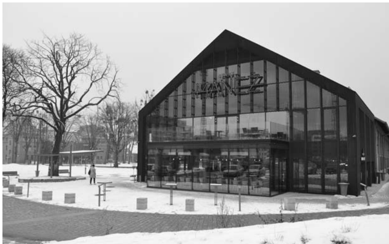
Fot. 2. Garnizon w Gdańsku Wrzeszczu – budynek dawnej ujeżdżalni koni - jeden z historycznych obiektów rozbudowany i zaadaptowany na cele usługowe/kulturotwórcze, stan 2018 r. (por. fot 1)