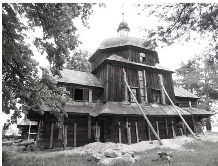
Rysunek 8. Remontowana cerkiew w Woli Wielkiej.

datkowo w trakcie wizytacji można także skontaktować się z lokalnym opiekunem obiektu, bądź też uzyskać informację kto jest zarządcą nieruchomości, pytając o to mieszkańców miejscowości. Część cerkwi nie jest już użytkowana jako świątynie i jest stale zamknięta. Są to obiekty trudno dostępne dla zwiedzających. Klucze do obiektu są u opiekuna albo w urzędzie gminy. W trakcie wizytacji można uzyskać informacje o dziejach danego obiektu. Osoby odpowiedzialne za udostępnianie danej cerkwi dla zainteresowanych, niejednokrotnie całe swoje życie spędziły w sąsiedztwie świątyni, stąd też są w stanie potwierdzić ilość i zakres ingerencji technicznych w strukturze obiektu, w ciągu ostatnich lat. Po wykonaniu wizji lokalnych liczba obiektów możliwych do zbadania zmalała z ośmiu do siedmiu.