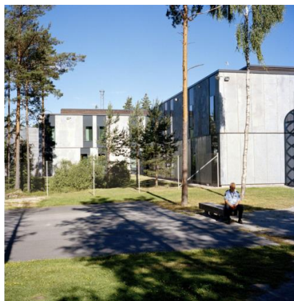
Fig. 3. Halden Prison: a view from the outside. Source: [11] Ryc.3. Halden Prison: widok zewnętrzny. Źródło: [12]