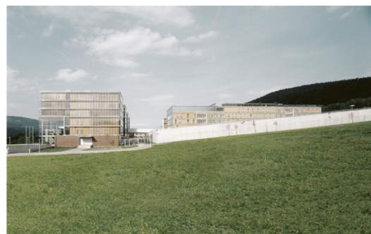
Fig. 7. Leoben Centre of Justice: on the left: a view of the Court – Part ; on the right: a view of the Prison - Part.

Ryc.7. Leoben Centre of Justice: po lewej: widok na część zajmowaną przez sąd; po prawej: widok na część zajmowaną przez więzienie.