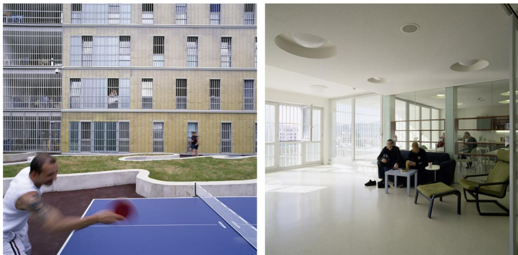
Fig. 8. Leoben Centre of Justice: a courtyard and an open space with natural lighting. Source: [14]

Such a design has led to more successful rehabilitation of prisoners and has put human life first. The Justice Center in Leoben has won the following awards: ULI – Urban Land Institute for Excellence 2009 in Europe, Middle East and Africa; Architecture prize of Styria Province 2004, Geramb-Rose, in appreciation for excellent construction 2006 [10,13].