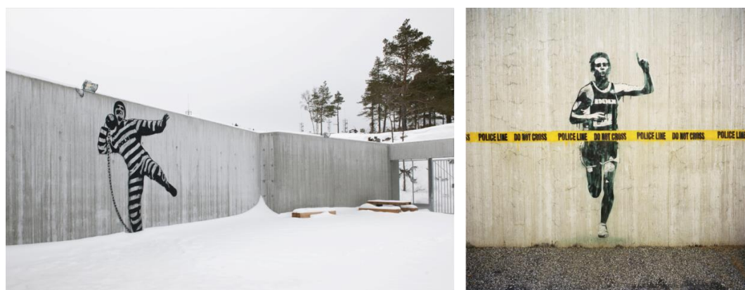
Fig. 1. Halden Prison: Murals made by Norwegian graffiti artist - Dolk. Source: [11] [12]

The aim of this project was to provide the highest standards of security while simultaneously respecting human rights, making it one of the best examples in the field of penitentiary architecture. Living conditions inside this facility were designed to be as similar to those on the outside as possible in order to allow the prisoners the chance to take part in the normal, daily routines of life away from prison. The housing blocks are separated from areas for activities and work. All the inmates participate in recreational, cultural and educational activities [10, 11].