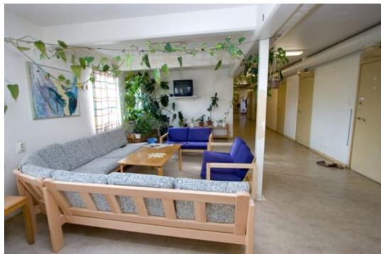
Fig. 5. Sollentuna Remand Prison: interior of the Tabellen 4.

Ryc. 5. Sollentuna Remand Prison: wnętrze budynku Tabellen 4.