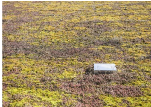
Fig. 6. Sollentuna Remand Prison: a green roof which helps to protect bee population. Source: [15]

Ryc. 5. Sollentuna Remand Prison: wnętrze budynku Tabellen 4. Źródło: [15]