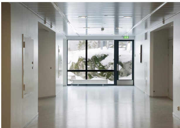
Fig. 2. Halden Prison: a view from the inside. Ryc.2. Halden Prison: widok wnętrza.