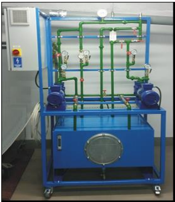
Rys.1. Widok ogólny stanowiska do badania warunków współpracy pomp wirowych.

pompowego dodatkowych (wymiennych) elementów przepływowych, o różnych charakterystykach struktury konstrukcyjnej (np. zawory z osadami zanieczyszczeń itp.), w celu prawidłowego rozpoznawania symptomów różnych stanów niezdatności eksploatacyjnej układu.