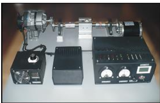
Rys. 2. Widok ogólny stanowiska do badania elektromechanicznego zespołu napędowego.

Stanowisko przeznaczone jest do celów dydaktycznych i pozwala przeprowadzić badania elektromechanicznego zespołu napędowego (rys. 2), ze szczególnym wyeksponowaniem pomiaru momentu skręcającego na wale napędowym.