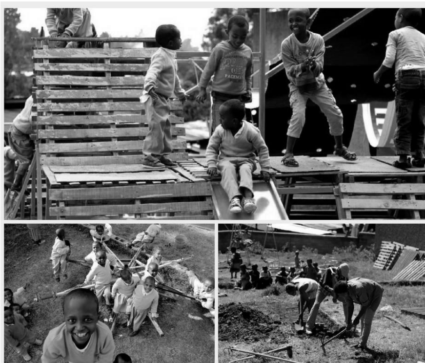
Rysunek 3. Plac zabaw zaprojektowany na terenie sierocińca w Etiopii.