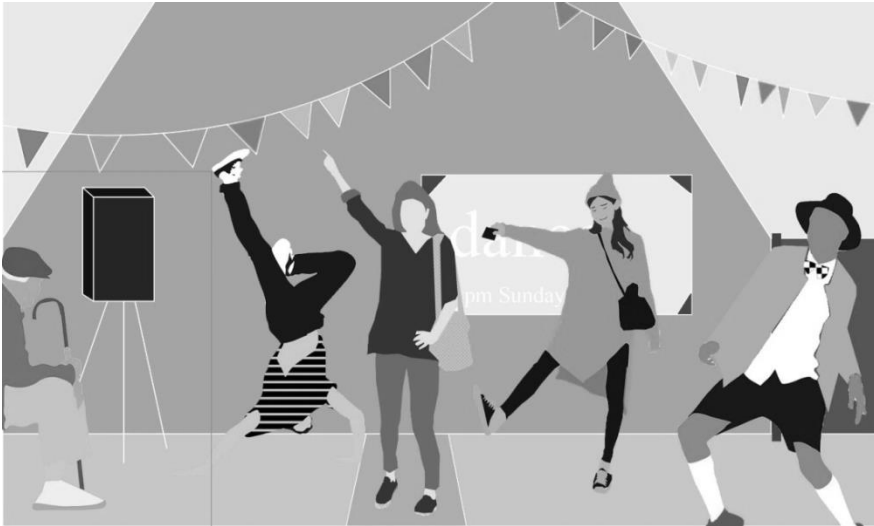
Rysunek 2. Inicjatywa taneczna Dance-O-Mat.

Projekt LQC stara się podejmować działania pomimo braku dostępnych środków na poprawę przestrzeni publicznej. Partycypacyjny i wspólnotowy charakter projektów to ostatni z czynników. Źródła finansowania mogą pochodzić z kampanii crowdsourcingowych, programów rządowych ukierunkowanych na działania kulturowe, prywatnych instytucji oraz fundacji, jak również firm usytuowanych w pobliżu działki.