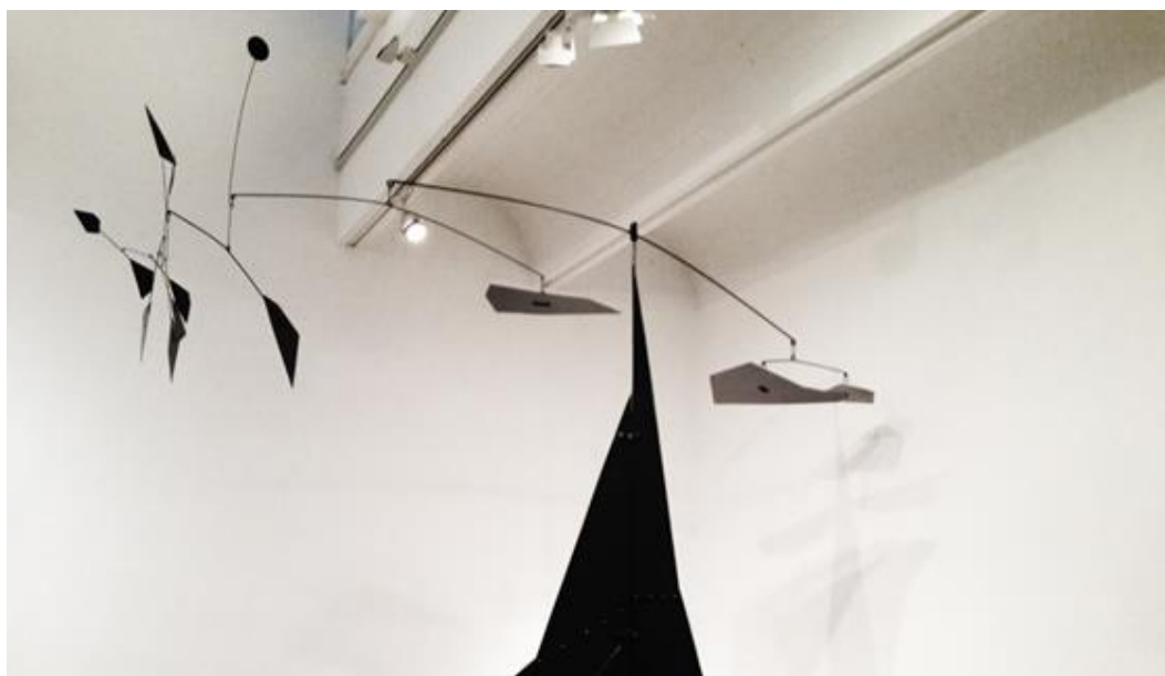
Fig. 1. Kinetic sculpture based on the principle of balance, Alexander Calder – El Corcovado 1951

For theoreticians of the perception of space from the late nineteenth century, space had kinematic features, because it was associated with the reception in motion. The contemporary observer can remain motionless and space can be perceived as a variable because it undergoes actual transformations due to the application of kinematic solutions. Many artists explored that field to achieve unique spatial effects. Starting in the early 1910s with Marcel Duchamp's Bicycle Wheel that can be considered first kinetic sculpture. The movement was also presented in the form of balance, an example of such is El Corcovado (Fig. 1) created in 1951 by Alexander Calder. At the time artists were inspired not only with new philosophical theories but also by photography, where artists experimented with diverse techniques to capture movement. In this aspect, the time-varying spaces presented by Duchamp, Calder or László Moholy-Nagy in the form of kinematic sculptural installations can be considered as precursors to contemporary kinetic architecture. [5]