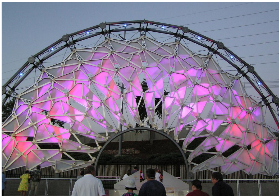
Fig. 3. A modern form of application of kinematic architecture, Hoberman Arch 2002, Source: Scott Catron, 2003 [3]

been able to show the potential of geometry to create spatially complex structures from simple components, where each of the designed panels can function independently or the facade as a whole can create complicated simulations showing any geometric patterns. [11] Visually, one can find great similarity to the classic Jean Nouvel's facade from 1987, created for the needs of the Arab World Institute.