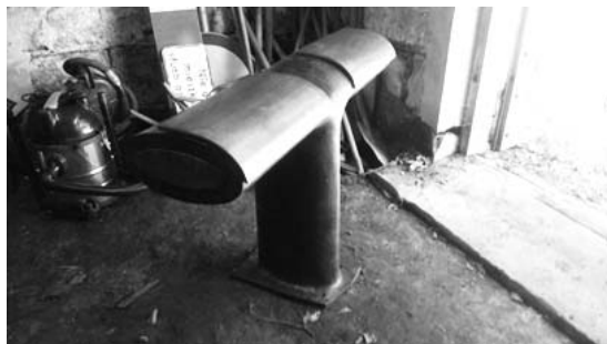
Fot. 3. Prototyp przysiadaka opracowany we współpracy Akademii Sztuk Pięknych i Politechniki Gdańskiej.

Uwarunkowania terenowe pasa drogowego często uniemożliwiają ustawienie odpowiedniej ławki, dlatego coraz popularniejszym rozwiązaniem jest ustawianie siedzisk tzw. przysiadków w celu chwilowego odpoczynku. W 2017 r. międzyuczelniany zespół składający się z pracowników Akademii Sztuk Pięknych w Gdańsku i Politechniki Gdańskiej opracował zestaw przysiadków w ramach realizowanego wspólnie projektu Smart City Seat (SCS) 10 . Projekt ma na celu rozwiązanie istotnych potrzeb społecznych wynikających z potrzeby poprawy jakości życia osób w podeszłym wieku. Jednocześnie ze względu na swoją konstrukcję może zapewniać bezpieczeństwo pieszym jako separator od ruchu rowerowego i kołowego. Wzmocniona konstrukcja pozwala na zastosowanie zespołu przysiadków jako fizycznej bariery chroniącej pieszych. Żelbetowa konstrukcja, mocne fundamentowanie, odpowiednie ustawienie oraz kształt utrudniają celowe sforsowanie bariery samochodem. Obecnie prototyp jest testowany w przestrzeni Gdyni (fot. 3 i 4) i przygotowywany do pierwszego wdrożenia.