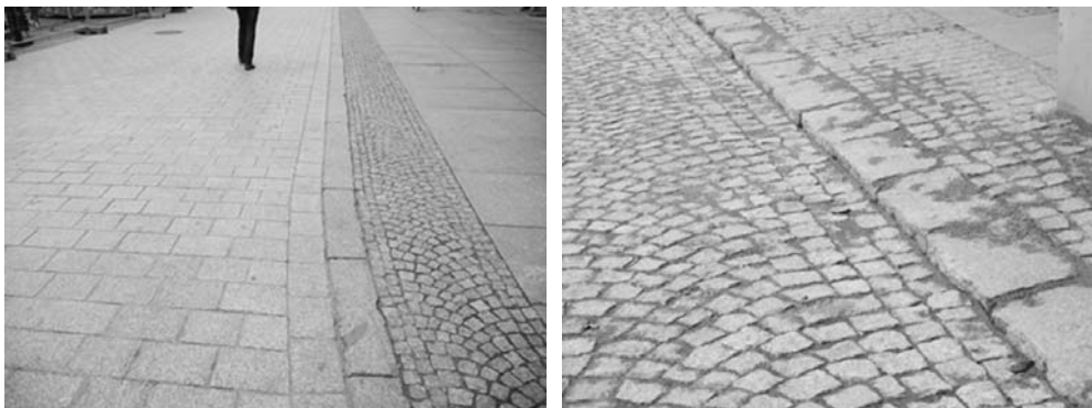
Fot. 5. Wygodna dla wszystkich nawierzchnia wokół wrocławskiego rynku