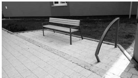
Fot. 2. Jedno z miejsc odpoczynku na terenie dzielnicy Chylonia, poddanej rewitalizacji w 2018 r.

W opracowanych Standardach Dostępności wprowadza się zasadę, aby w odstępach co 50 – 100 m przewidzieć miejsce odpoczynku zlokalizowane poza trasą wolną od przeszkód. Miejsce to powinno być wyposażone w ławkę z oparciami i podłokietnikami. W obrębie miejsca odpoczynku wymaga się przestrzeni umożliwiającej zaparkowanie wózka inwalidzkiego. Miejsce postoju dla osoby poruszającej się na wózku powinno mieć głębokość min. 140 cm (zalecane 180 cm) i szerokość 90 cm (ryc. 1), tak aby osoba na wózku czy skuterze inwalidzkim mogła zaparkować wózek obok ławki, nie przeszkadzając innym użytkownikom poruszającym się po ciągu pieszym. Miejsce odpoczynku powinno być wydzielone od ciągu pieszego fakturą w postaci specjalnej płytki chodnikowej typu C1 9 lub zabruku z kostki kamiennej łamanej. Jako zalecenie proponuje się przy każdym z miejsc odpoczynku zainstalować stojak dla rowerów. Przykład zrealizowanych miejsc odpoczynku podczas prowadzonych prac rewitalizacji w dzielnicy Chylonia w Gdyni przedstawia fot. 2.