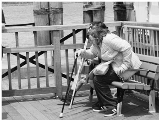
Fot. 1. Ławki zaopatrzone w podłokietniki ułatwiają wstawanie i siadanie osobom starszym

Przestrzenie podlegające rewitalizacji obejmują obszary zdegradowane, na których zamieszkują często osoby w podeszłym wieku. Dlatego należy tym baczniej spojrzeć na rozwiązania, które powinny zapewnić tym osobom wygodne poruszanie się w przestrzeni publicznej. Specyfiką osób starszych jest to, że swoje decyzje o wyjściu z domu, a tym samym o swojej aktywności w lokalnej społeczności, opierają często na możliwości pokonania pewnych odległości od tego, czy mogą na swojej trasie znaleźć przyjazne dla siebie miejsca odpoczynku wyposażone w ławkę z podłokietnikami (fot. 1). Wiele z tych osób powłóczy nogami i każda nierówność chodnika utrudnia w znaczny sposób poruszanie się w przestrzeni. Stąd tzw. trasy wolne od przeszkód powinny mieć równe, antypoślizgowe nawierzchnie. Gdy na danej trasie są schody, powinny być one wyposażone w odpowiednie poręcze, najlepiej na dwóch wysokościach 75 i 95 cm, a także wysunięcia poziome poza pierwszy i ostatni stopień, aby umożliwić stabilny pochwyt. Dotyczyć to powinno każdej różnicy w terenie, mimo to, że wymagania stawiane przez warunki techniczne wymuszają stosowanie poręczy przy schodach pokonujących różnice w rzędnych terenu powyżej 50 cm 7 . Te i inne rozwiązania proponowane są w Standardach Dostępności opracowanych przez Centrum Projektowania Uniwersalnego 8 działającego na Wydziale Architektury Politechniki Gdańskiej.