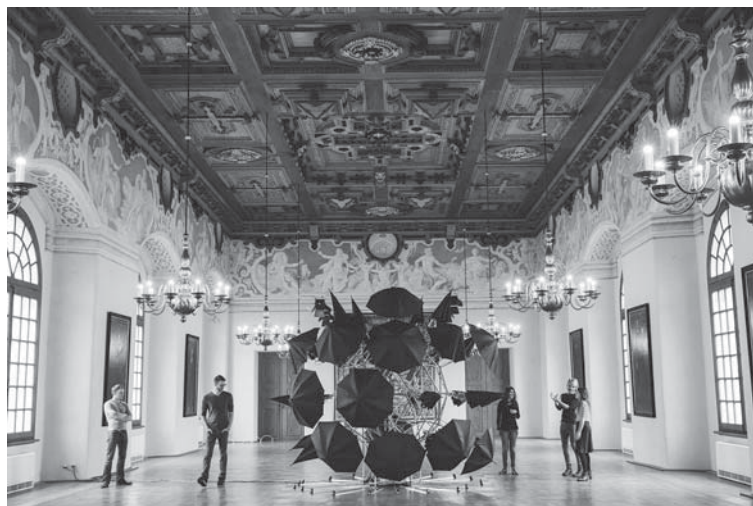
Fot. 2. Instalacja interaktywna Surface X, autorstwa grupy Picaroon

Pierwszym przykładem takiej sztuki jest instalacja o nazwie "Softer" w obiekcie już wcześniej wspomnianym w Pałacu Blenheim w Anglii, która odbywała się od 28 września do 31 grudnia 2017 r. Tym razem autorką jest Amerykanka Jenny Holzer, która w swej twórczości koncentruje się na współczesnych konfliktach. Inspiracją dla jej instalacji była wojskowa historia pałacu. Barokowy zespół pałacowo-parkowy stanowił podarunek królowej dla Johna Churchilla, hrabiego Marlborough, za zwycięstwo w bitwie w 1704 r. Artystka użyła tego dziedzictwa jako punkt wyjścia do spojrzenia na ponadczasowy i uniwersalny temat konfliktów [ Blenheim Art Foundation 2017]. Do realizacji wykorzystała elementy kamienne, technologię, aplikacje