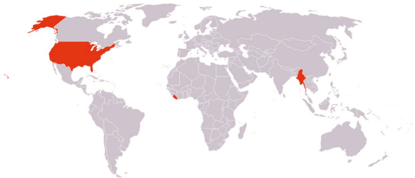
Rys. 1. Stosowalność systemu metrycznego i systemu niemetrycznego (kraje, które oficjalnie przyjęły system metryczny zaznaczono kolorem szarym) [28]

Na podstawie Rozporządzenia Rady Ministrów z dnia 23 czerwca 1966 roku w sprawie ustalenia legalnych jednostek miar przyjęto w Polsce Międzynarodowy Układ Jednostek Miar (SI). Od początku nowego milenium obowiązywały w Polsce normy: PN-ISO 31-0:2001 (wersja polska) pt. „Wielkości fizyczne i jednostki miar – Zasady ogólne” oraz PN-ISO 1000:2001 (wersja polska) pt. „Jednostki miar SI i zalecenia do stosowania ich krotności oraz wybranych innych jednostek miar”. Polski Komitet Normalizacyjny w dniu 26 lipca 2013 roku wycofał te normy i jednocześnie – bazując na międzynarodowym standardzie ISO/IEC 80000 opisującym i określającym nazwy, symbole i definicje jednostek miar – wprowadził na ich miejsce normę PN-EN ISO 80000-1:2013-07 (wersja angielska) pt. „Wielkości i jednostki – Część 1: Postanowienia ogólne”.