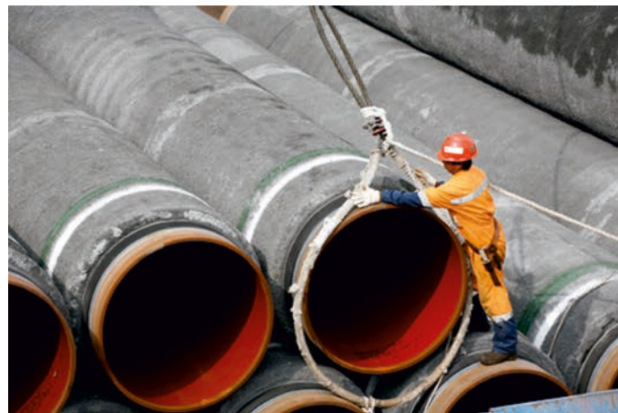
Rys. 6. Rury wielkośrednicowe, każda o długości 24 m – tak zwane dublety, średnicy wewnętrznej D_i = 1,2192 m (48 cali) i grubości ścianki stalowej t = 38,1 mm (1,5 cala), wykorzystane do budowy gazociągu „Nord Stream”, ułożonego na dnie Morza Bałtyckiego [37]

Transport ropy naftowej i gazu ziemnego ze złóż podmorskich do baz ładowych odbywa się z wykorzystaniem ogromnej flotyli zbiornikowców oraz bardzo rozbudowanej sieci rurociągów podmorskich, w szczególności długich rurociągów przesyłowych (rys. 6). Oczywiście, z racji bogatego doświadczenia i długiej tradycji, większość literatury dotyczącej zagadnień