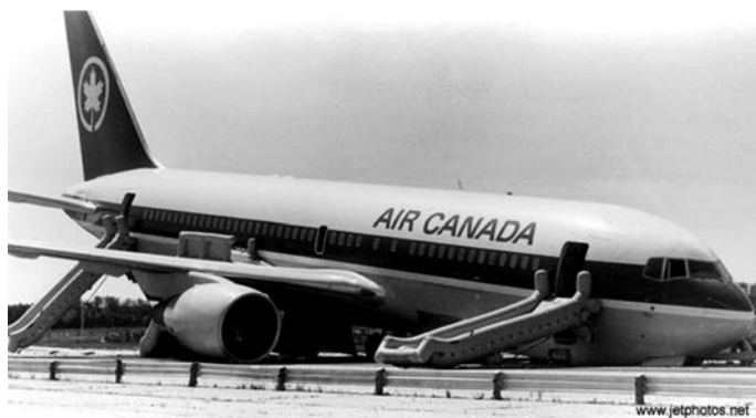
Rys. 2. Samolot „Gimli Glider” po wylądowaniu na płycie nieczynnego już lotniska [34]

ryzykownym lądowaniu zniszczeniu uległo przednie podwozie, a dziób samolotu opadł na płytę lotniska (rys. 2). Z całkowitej liczby 69 osób na pokładzie (61 pasażerów i 8 członków załogi) tylko 10 osób doznało niegroźnych obrażeń, głównie w trakcie ewakuacji.