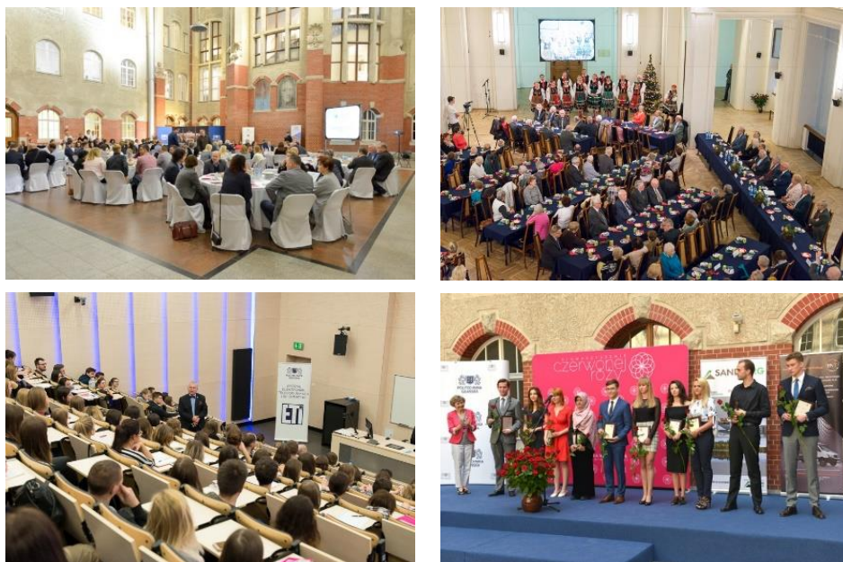
Rys. 4. Kultura akademicka na PG

(International Christmas Tree, 16.12.2016, fot. P. Niklas; Narodowe Święto Niepodległości na Politechnice Gdańskiej, 10.11.2017, fot. K. Krzempek; Zjazd absolwentów Wydziału Zarządzania i Ekonomii 2017, 18.11.2017, fot. P. Niklas; Spotkanie oplatkowe, 28.12.2017, fot. P. Niklas; Wykład fakultatywny z przedmiotu humanistyczno-społeczny, pt. „Proces poznawczy w naukach przyrodniczych”, który wygłosił prof. dr hab. inż. Janusz Mrocza, dr. h. c. mult., 26.02.2018, fot. P. Niklas; Gala Konkursu Czerwonej Róży 2018, 27.05.2018, fot. K. Krzempek)