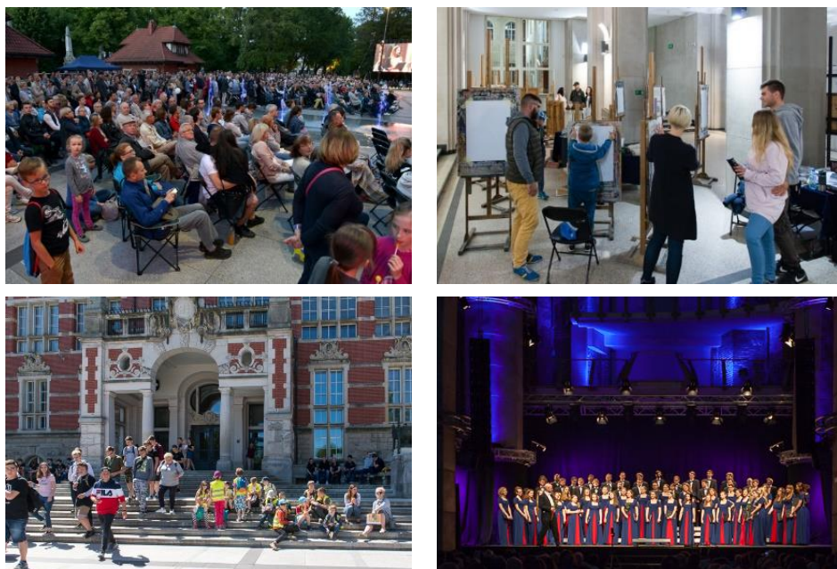
Rys. 5. Trzecia misja na PG

(Spotkanie i spacer po kampusie z autorami albumu „Kampus Politechniki Gdańskiej”, 7.10.2017, fot. P. Niklas; Koncert Bożonarodzeniowy w Centrum św. Jana, 9.12.2017, fot. P. Niklas; Koncert Muzyki Cerkiewnej, 14.04.2018, fot. P. Niklas; Europejska Noc Muzeów na Politechnice Gdańskiej, 19.05.2018, fot. P. Niklas; Bałtycki Festiwal Nauki na PG, 23.05.2018, fot. P. Niklas; „Muzyka wody i ognia” – pierwszy koncert plenerowy na Politechnice Gdańskiej, 16.06.2018, fot. K. Krzempek)