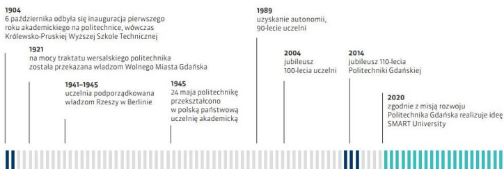
Rys. 3. Biznesowe zarządzanie Politechniką Gdańską