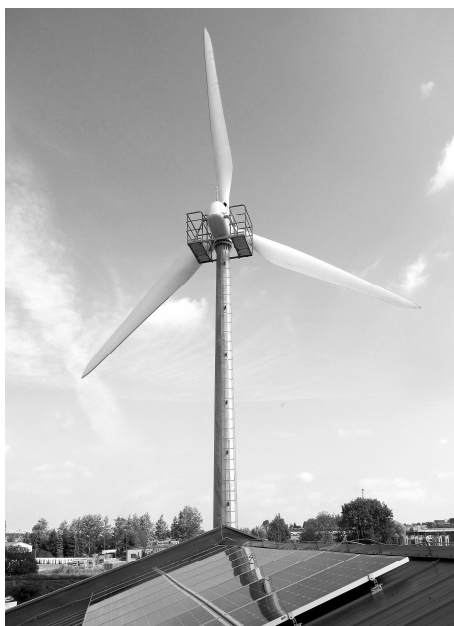
Rys. 1. Badana elektrownia hybrydowa

W elektrowni wiatrowej usytuowanej na wieży o wysokości 21 m, o średnicy 16 m i stałym kącie ustawienia łopat, prędkości znamionowej 60 obr/min, generatorem jest maszyna asynchroniczna klatkowa z przekładnią. Generator przyłączony jest do sieci przez dwukierunkowy falownik napięcia zbudowany z krzemowych tranzystorów IGBT. W procesorze sterującym zaimplementowany jest oryginalny algorytm sterowania, dedykowany dla małych elektrowni wiatrowych [8]. Celem algorytmu jest zapewnienie bezpieczeństwa elektrowni przy silnym wietrze i zwiększenie jej sprawności przy mniejszych wartościach wiatru. Ponieważ elektrownia wiatrowa służy do badań a algorytmy sterowania elektrownią są modyfikowane i testowane, to włączana jest w godzinach pracy; nie pracuje całą dobę.