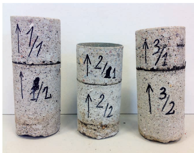
FOT. Widok pobranych rdzeni (przykład – hala nr 2); fot.: T. Majewski