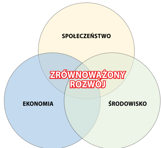
Rys. 2. Schemat idei zrównoważonego rozwoju; opracowanie własne na podstawie [23]

Budownictwo jako jeden z podstawowych działów gospodarki obejmuje wznoszenie, konserwację, remontowanie i rekonstrukcje obiektów budowlanych, zapewniając zaspokojenie potrzeb mieszkaniowych oraz społecznych. Natomiast pojęcie zrównoważonego budownictwa zostało wskazane przez Komisję Europejską w „Inicjatywie rynków pionierskich dla