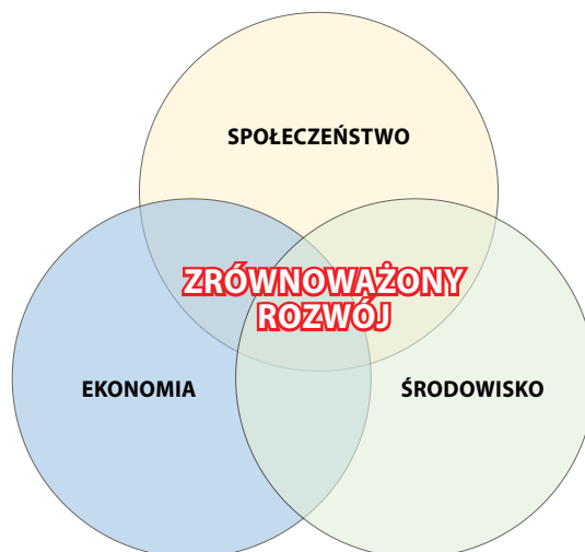
Rys. 2. Schemat idei zrównoważonego rozwoju; opracowanie własne na podstawie [23]

Budownictwo jako jeden z podstawowych działów gospodarki obejmuje wznoszenie, konserwację, remontowanie i rekonstrukcje obiektów budowlanych, zapewniając zaspokojenie potrzeb mieszkaniowych oraz społecznych. Natomiast pojęcie zrównoważonego budownictwa zostało wskazane przez Komisję Europejską w „Inicjatywie rynków pionierskich dla