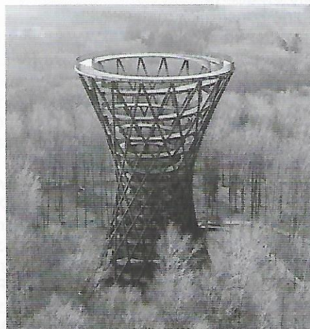
Rys. 1. Wieża widokowa w Haslev – widok ogólny. Fot. Rasmus Hjortshøj [2]

W rozległej przestrzeni chronionego lasu Gissenfeld Klosters w południowo-wschodniej Zelandii pod Kopenhagą została 30 marca 2019 roku oddana do użytkowania wieża widokowa jako jeden z elementów trasy rekreacyjnej (rys. 1). Z tarasu panoramicznego usytuowanego na szczycie wieży można podziwiać krajobraz leśny, korony otaczających drzew,