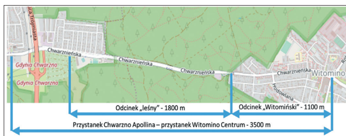
Rys. 1. Lokalizacja analizowanych odcinków na ul. Chwarznieńskiej

Na rysunku 2 przedstawiono wykres średnich czasów przejazdu w poszczególnych godzinach w ciągu doby z 5 dni wroczych w maju 2017 roku pomiędzy skrajnymi przystankami na odcinku około 3,5 km oraz na odcinku „leśnym” i „witomińskim”. Głównym miejscem występowania opóźnień na całej analizowanej trasie jest przede wszystkim odcinek „leśny”. Opóźnienia sięgały średnio w godzinach szczytu porannego około 6 min, a w skrajnych przypadkach około 10 minut. Na odcinku „witomińskim” nie odnotowano znaczących opóźnień (od 1 do 2 minut podczas szczytu porannego). Należy nadmienić, że podczas szczytu