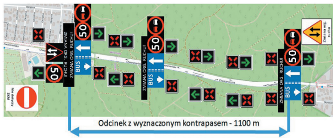
Rys. 4. Schemat scenariusza organizacji ruchu z uruchomionym kontrapasem autobusowym