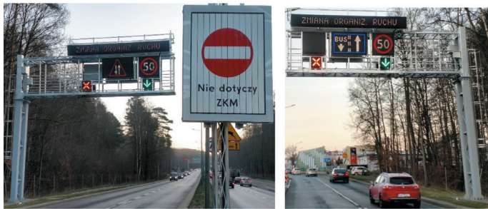
Rys. 5. Oznakowanie kontrapasów: a) przed wjazdem dla autobusów, b) dla ruchu ogólnego

na jego końcu, a trzeci na głównym skrzyżowaniu w centralnej części dzielnicy Witomino) są na bieżąco przesyłane do Centrum Zarządzania i Sterowania Ruchem w Gdyni. Trwają prace nad ustaleniem warunków brzegowych i wdrożeniem rozwiązania, które pozwoli na uruchamianie kontrapasa w sposób półautomatyczny, sugerując operatorowi jego włączenie, a w przypadku pozytywnych testów w sposób automatyczny. Planowane rozwiązanie pozwoli na optymalizację decyzji o włączeniu kontrapasa poprzez redukcję liczby przypadków, w których operator nie ma pewności czy uruchomienie przyczyni się do zmniejszenia strat czasu pojazdów transportu zbiorowego lub w porę nie zauważa konieczności podjęcia działań.