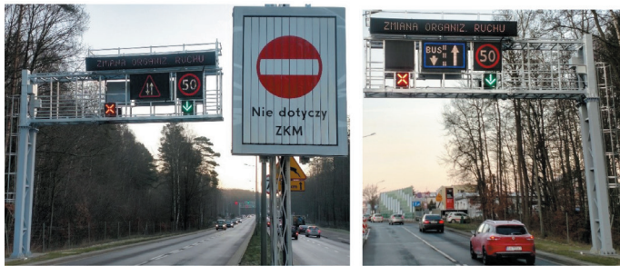
Rys. 5. Oznakowanie kontrapasa: a) przed wjazdem dla autobusów, b) dla ruchu ogólnego

na jego końcu, a trzeci na głównym skrzyżowaniu w centralnej części dzielnicy Witomino) są na bieżąco przesyłane do Centrum Zarządzania i Sterowania Ruchem w Gdyni. Trwają prace nad ustaleniem warunków brzegowych i wdrożeniem rozwiązania, które pozwoli na uruchamianie kontrapasa w sposób półautomatyczny, sugerując operatorowi jego włączenie, a w przypadku pozytywnych testów w sposób automatyczny. Planowane rozwiązanie pozwoli na optymalizację decyzji o włączeniu kontrapasa poprzez redukcję liczby przypadków, w których operator nie ma pewności czy uruchomienie przyczyni się do zmniejszenia strat czasu pojazdów transportu zbiorowego lub w porę nie zauważa konieczności podjęcia działań.