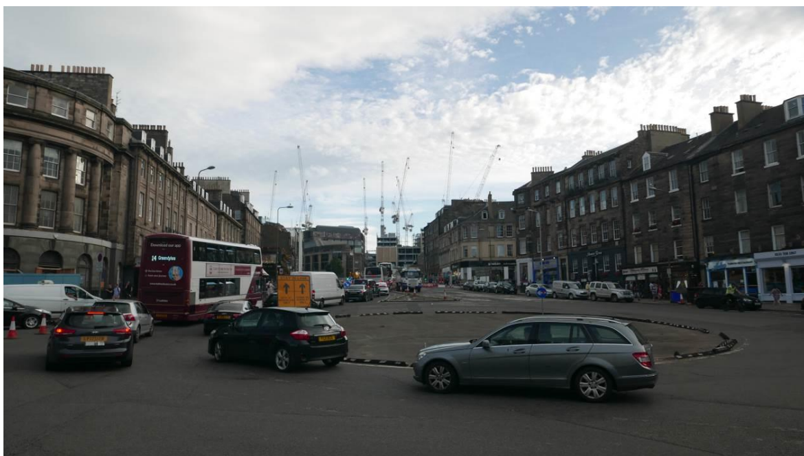
Fig. 2. Leith Walk – the view on revitalized St James Shopping Center.

Ryc.1. Wzgórze Arthur Seat, Edynburg od strony południowej.