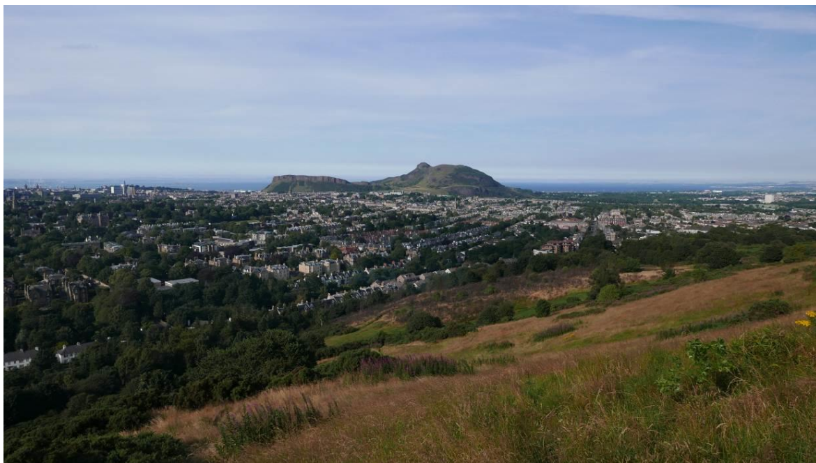
Fig. 1. Arthur's Seat Hill, south Edinburg view.

Ryc.1. Wzgórze Arthur Seat, Edynburg od strony południowej.