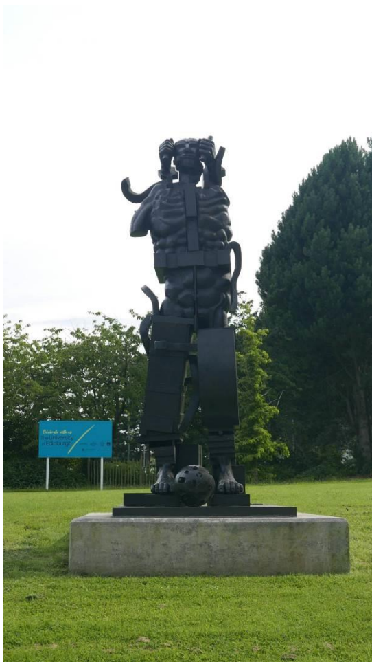
Fig. 8. Paolozzi sculpture 'Parthenope' 1996 temporary location due to the construction works near the School of Biological Sciences, The University of Edinburgh.

Ryc. 8. Rzeźba Paolozziego pt. 'Parthenope', 1996, tymczasowo przeniesiona z powodu prac remontowych umiejscowiona w okolicy Wydziału Nauk Biologicznych Uniwersytetu Edynburskiego.