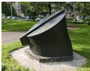
Fig. 3. Ankle

Ryc. 3. Kostka