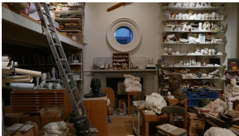
Fig. 6. Paolozzi studio at Scottish National Gallery of Modern Art Two. Source: author's archive, Author: W.Kołodkowski

Ryc. 5. Ręka. Źródło: archiwum własne, Autor: W.Kołodkowski