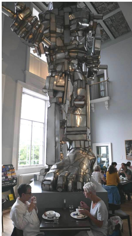
Fig. 9. Paolozzi sculpture 'Vulcan' in the restaurant corner of National Galleries of Scotland.

Ryc. 8. Rzeźba Paolozziego pt. 'Parthenope', 1996, tymczasowo przeniesiona z powodu prac remontowych umiejscowiona w okolicy Wydziału Nauk Biologicznych Uniwersytetu Edynburskiego.