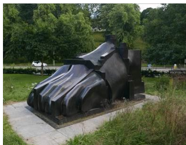
Fig. 4. Foot.

Ryc. 3. Kostka