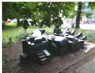
Fig. 5. Hand.

Ryc. 4. Stopa