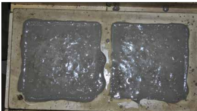
Fot. 7. Próbkę zarobów próbnych, na powierzchni próbek widoczny zaczyn cementowy (bleeding)