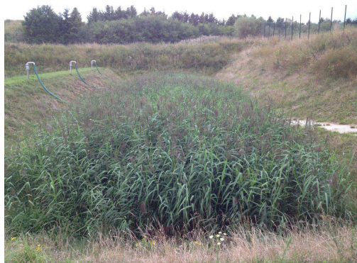
Rys. 2 Doprowadzenie osadów za pomocą rur umieszczonych z boku kwatery w Gnieźnie

Przez około 30 lat systemy trzcinowe stosowane do przeróbki osadów znalazły zastosowanie w oczyszczalniach ścieków obsługujących od kilkuset do nawet 125 000 Równoważnej Liczby Mieszkańców (RLM) (Uggetti i in. 2009, Nielsen, 2003). Zatem można przyjąć, że pojemność systemów trzcinowych nie jest parametrem ograniczającym ich stosowanie. Technologia ta może być stosowana, jeśli tylko jest dostępna wymagana powierzchnia.