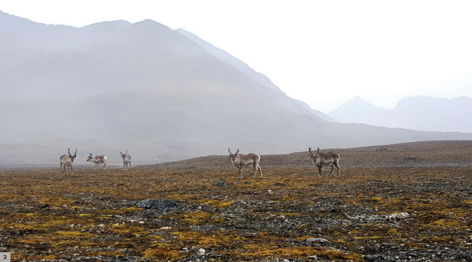
Fot. 2. Stado reniferów w dolinie Revdalen