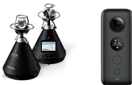
Rys. 1. Mikrofon ambisoniczny pierwszego rzędu - ZOOM H3-VR oraz kamera 360 – Insta360 ONE X [9] [21]

Wybór urządzeń do przeprowadzenia nagrań podyktowany był mobilnością sprzętu, przy zachowaniu dostatecznie wysokiej jakości materiałów audio i wideo. Podczas realizacji skorzystano z mikrofonu ambisonicznego pierwszego rzędu ZOOM H3-VR z wbudowanym rejestratorem oraz z kamery Insta360 ONE X , które przedstawiono na rysunku 1. Oba urządzenia w czasie nagrań mocowano w jednej osi na dwustronnym uchwycie, kamera była skierowana do góry, a mikrofon do podłoża. Natomiast sam uchwyt montowany był na statywie.