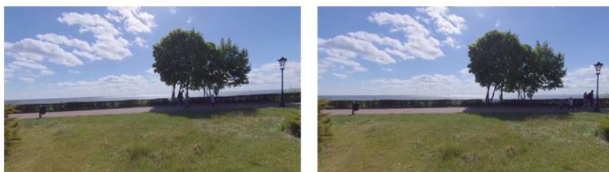
Rys. 3. Efekt wypoziomowania obrazu za pomocą wtyczki VR Sphere Rotation

Po zapoznaniu się z zarejestrowanymi materiałami wideo uznano, że poza standardową obróbką w postaci przycięcia ścieżek do docelowej długości, konieczna będzie ich dodatkowa edycja ze względu na przechylenia obrazu względem podłoża oraz na widoczny w kadrze statyw oraz mikrofon. W celu wypoziomowania obrazu użyto wtyczki VR Sphere Rotation dostępnej w ramach oprogramowania Adobe Premiere Pro . Przykład porównania przed i po wprowadzonej korekcie zaprezentowano na rysunku 3. Natomiast znajdujące się w kadrze statyw oraz mikrofon zasłonięto, nakładając na obraz maskę z logiem Katedry Systemów Multimedialnych. Materiały wideo wyeksportowano bez ścieżki dźwiękowej w formacie MPEG-4 dla parametrów jednakowych z parametrami zarejestrowanego nagrania [12].