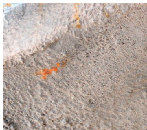
Fot. 2. Zbliżenie na torkret z inhibitorem korozji po 6 miesiącach od naprawy