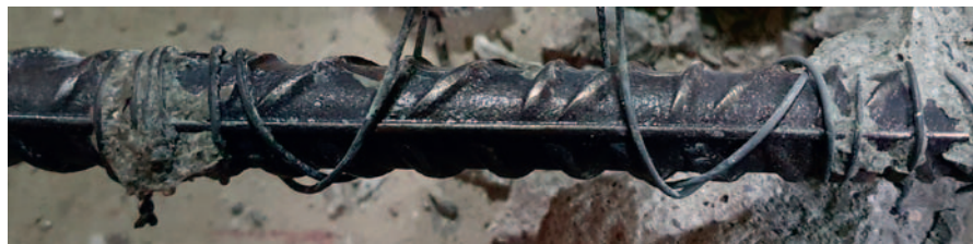
Fot. 5. Widok na chroniony pręt zbrojeniowy w odległości około 40 cm od miejsca podłączenia do protektora