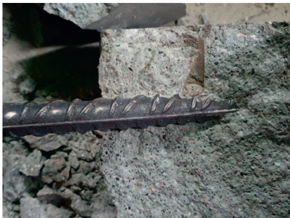
Fot. 4. Widok na chroniony pręt zbrojeniowy w miejscu podłączenia protektora