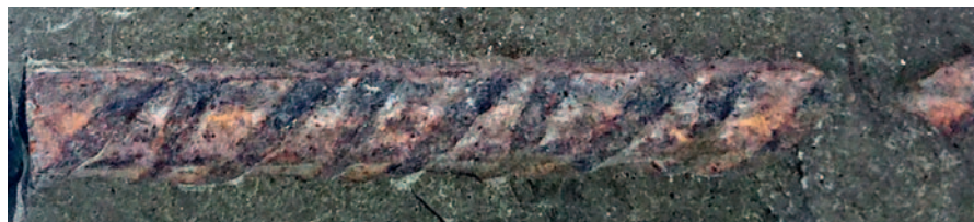
Fot. 6. Widok na pręt bez ochrony katodowej, widoczna korozja całej powierzchni pręta