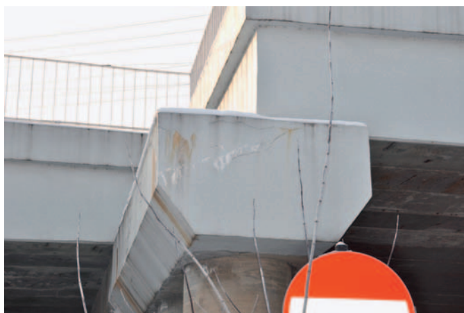
Fot. 1. Korozja ocieplenia podporu po kilku miesiącach od naprawy