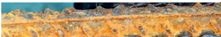
Fot. 7. Szczegół pręta bez ochrony katodowej, widoczna korozja całej powierzchni pręta