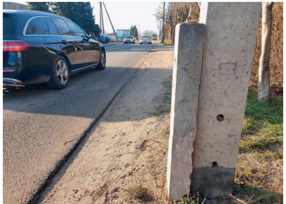
Fot. 3. Widok na próbkę żelbetową z zatopionymi prętami z protektorem

Badania (podobnie jak w [14]) polegały na comiesięcznym pomiarze potencjałów korozyjnych zarówno pręta chronionego protektorem, jak i pręta bez ochrony katodowej. Na rys. 2 przedstawiono wartości pomierzonych potencjałów w okresie 120 miesięcy. Należy zaznaczyć, że w okolicy 77. miesiąca, czyli po około 6 latach ekspozycji, na powierzchni betonu próbki pojawiły się mikrozarysowania, które pozwalały na głębszą penetrację wody i chlorków. Analizując wykres pomierzonych potencjałów korozyjnych pręta chronionego, widać, jak w pierwszych miesiącach potencjał systematycznie spadał. Po około 7 miesiącach ustabilizował się on na poziomie -550 mV i później, w zależ-