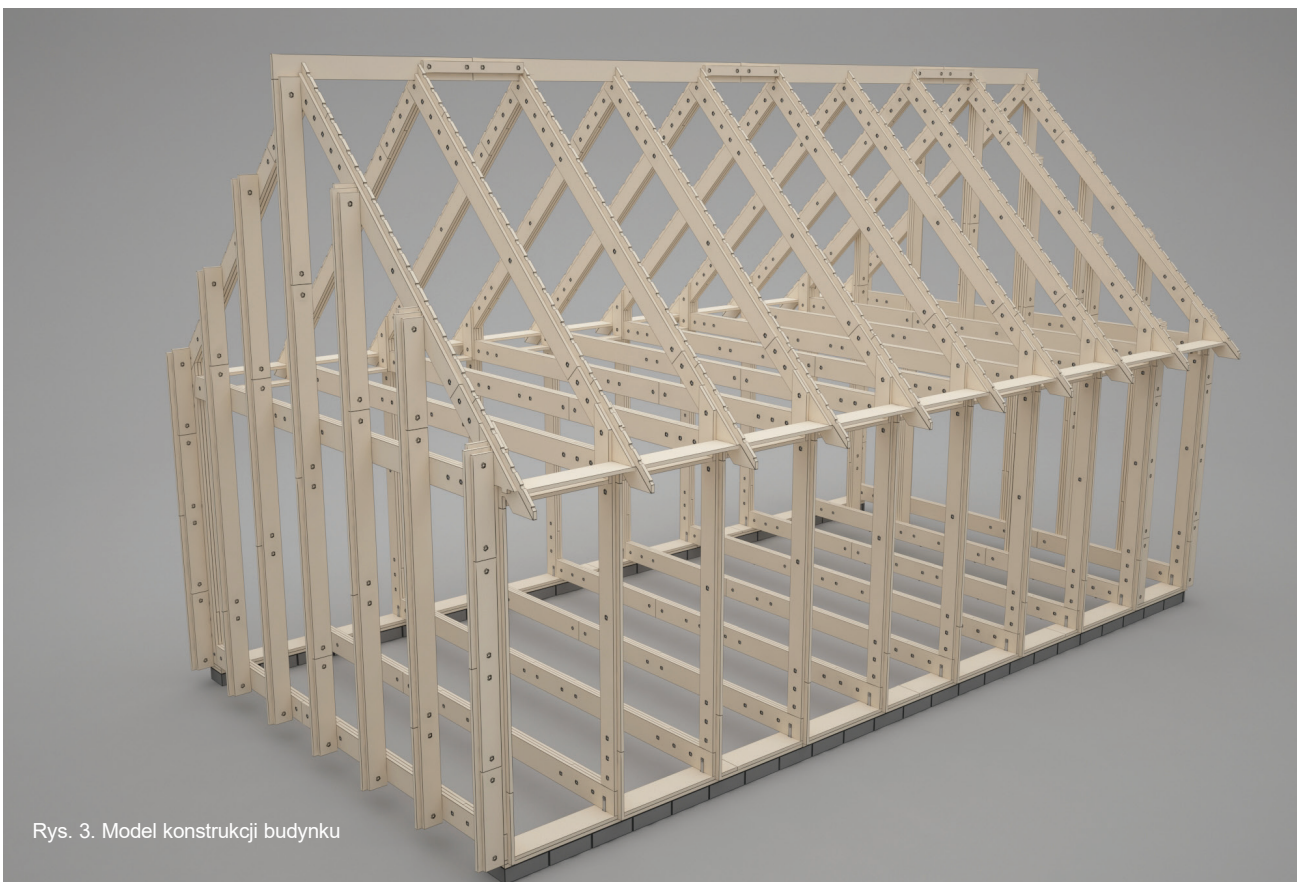
Rys. 3. Model konstrukcji budynku

Płyty z materiałów drewnopochodnych mają ograniczenia wymiarowe wynikające z rozmiarów standardowych płyt. Wykonanie z nich belki o odpowiednio dużym przekroju i długości wymaga łączenia warstwowego. Ten aspekt stał się motorem koncepcji konstrukcyjnej systemu. Dzięki zasadzie tworzenia głównych elementów konstrukcyjnych przez łączenie mniejszych części można stworzyć strukturę nośną z komponentów nieprzekraczających wymiarów standardowych płyt zarówno w zakresie grubości, jak i długości. Są one łatwe w transporcie, mogą być przenoszone oraz montowane przez dwie osoby posługujące się siłą własnych rąk i kilkoma prostymi narzędziami. Możliwa jest także wymiana poszczególnych części w razie potrzeby bez konieczności wymiany całego elementu. Możliwe jest również tworzenie różnych wariantów przekrojów oraz kombinacji elementów o przekrojach zmieniających się na całej długości. Można także łatwo uformować detale łączące, np. zagłębienia, gniazda, zamki (rys. 1.).