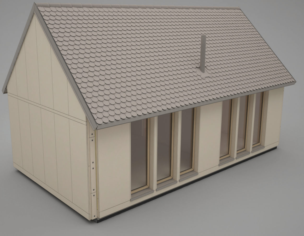
Rys. 4. Model budynku z wykończeniem zewnętrznym

W ten sposób każdy wiązary może zostać zaopatrzone w wypustki sytuujące go na podwalinie, a skrajne wiązary w otwory do łatwego montażu konstrukcji ścian szczytowych. Słupy konstrukcji ścian zewnętrznych zyskują element analogiczny dołaty (dzięki temu po montażu elewacji wytworzy się szczelina wentylacyjna) oraz zatrzaski do mocowania płyt elewacyjnych. Analogicznie można wykonać krokwie dachowe z odpowiednikami łat z wyciętymi wpustami pod kontrłaty, a także zagłębienia i nacięcia do montażu opierzeń. W elementach konstrukcyjnych ścian i dachu można uwzględnić mocowania dla płyt wiatrochronnych oraz usztywniających. Wiazary mogą posiadać zamki służące do lokalizacji i montażu elementów łączących je wzajemnie oraz pod obudowy okien, a także belkę kalenicową. Ponadto można wykonać nacięcia oraz przeloty dla instalacji elektrycznej i sanitarnej oraz wpusty na elementy takie jak konstrukcja ścian działowych, wykończenia ścian czy balustrady.