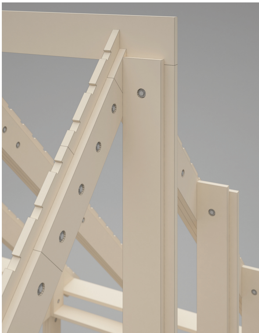
Rys. 1. Przykładowy detal łączenia elementów konstrukcyjnych

Opisane podejścia różnią się hierarchią celów. Część jest wyraźniej ukierunkowana na aspekty środowiskowe, część na ekonomiczne, inne mają wyraźny rys społeczny. Prosumpcyjne podejście do procesu budowania nie jest w ich przypadku podstawowym założeniem, a drogą do realizacji innych założeń. Łączy je dążenie do upraszczania rozwiązań zarówno przestrzennych, jak i technologicznych, bazując w większości na materiałach nisko przetworzonych, popularnych, łatwo dostępnych. Mimo to potrzebne jest chociaż minimalne