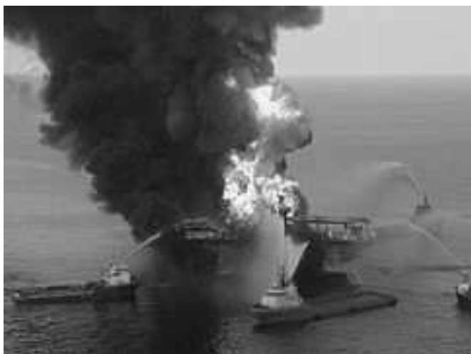
Rys. 2. Eksplozja platformy wiertniczej Deepwater Horizon [5]

Historia pokazała na przykładzie katastrofy w 2010 roku jak wielkie znaczenie ma utrzymywanie krytycznych urządzeń na obiekcie offshore (ang. na morzu) we właściwym stanie technicznym. Na rysunku 2 eksplozja platformy wiertniczej Deepwater Horizon, która miała miejsce 20 kwietnia 2010.