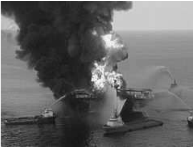
Rys. 2. Eksplozja platformy wiertniczej Deepwater Horizon [5]

Historia pokazała na przykładzie katastrofy w 2010 roku jak wielkie znaczenie ma utrzymywanie krytycznych urządzeń na obiekcie offshore (ang. na morzu) we właściwym stanie technicznym. Na rysunku 2 eksplozja platformy wiertniczej Deepwater Horizon, która miała miejsce 20 kwietnia 2010.