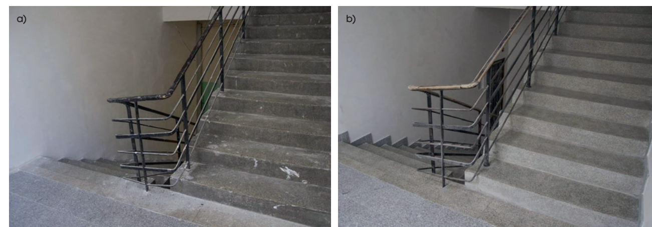
Fot. 1. Renowacja i naprawa posadzki typu lastrico w wielorodzinnym budynku mieszkalnym – posadzka: a) przed naprawą, b) po naprawie (M1)

ne z intensywną eksploatacją, lokalne ubytki w nawierzchni, konieczność naprawy posadzki w strefie wejściowej. W ramach prac naprawczych wykonano: a) gruntowne czyszczenie posadzki wraz ze szlifowaniem i wyrównaniem powierzchni, b) odtworzenie posadzki w strefie wejściowej, c) końcowe zabezpieczenie i impregnację. Szczególną uwagę należy zwrócić na zastosowanie podczas prac naprawczych