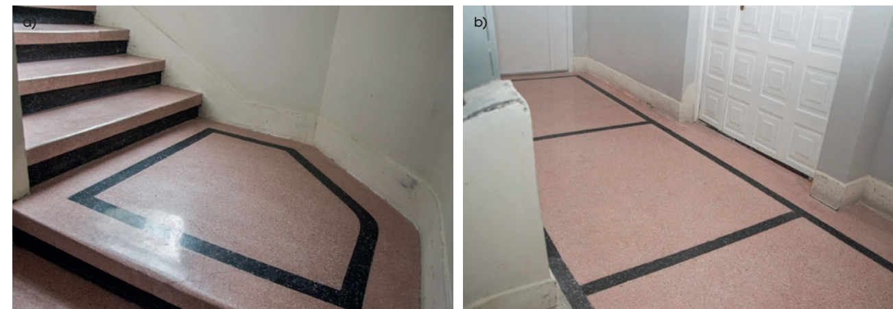
Fot. 3. Renowacja i naprawa kolorowej posadzki typu lastrico w wielorodzinnym budynku mieszkalnym – stan po pracach remontowych: a) wykończenie schodów, b) posadzka w korytarzach (M1)