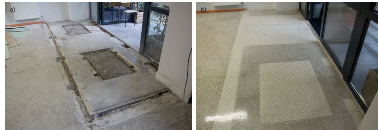
Fot. 2. Naprawa i renowacja posadzki typu lastrico w budynku szkoły – posadzka: a) przed naprawą, b) po naprawie (M1)