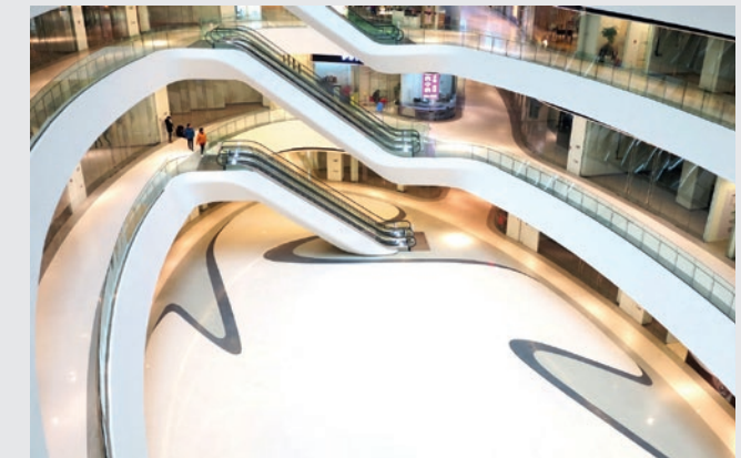
Galaxy SOHO China, proj. Zaha Hadid