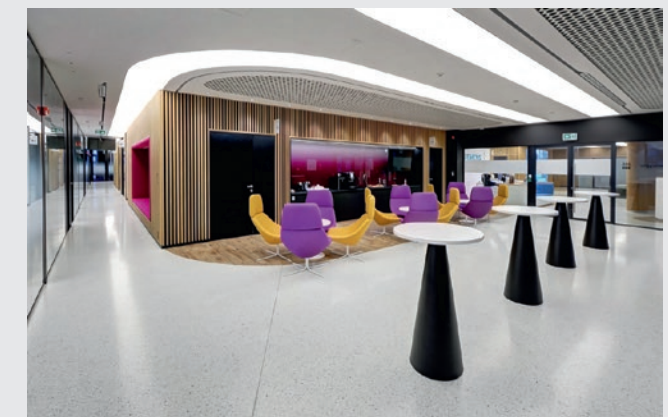
Kampus biurowy firmy Siemens w Warszawie

Posadzka typu szlifowane i polerowane terazzo żywiczne, np. Mondéco Classic marki Flowcrete, jest wykonywana z barwionej żywicy epoksydowej i naturalnego kruszywa marmurowego. Jej gładka powierzchnia przypominająca szlachetny kamień to wynik pracochłonnej i czasochłonnej obróbki mechanicznej.