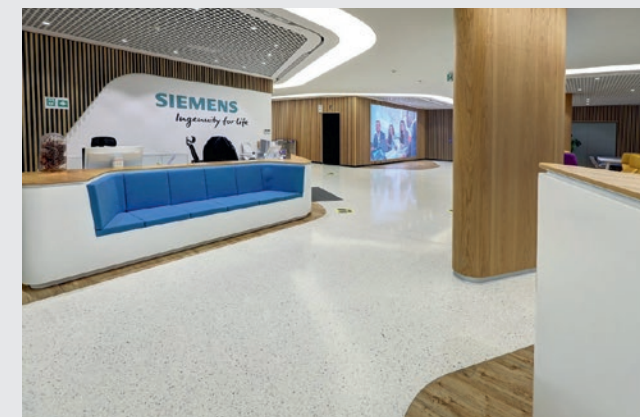
Kampus biurowy firmy Siemens w Warszawie