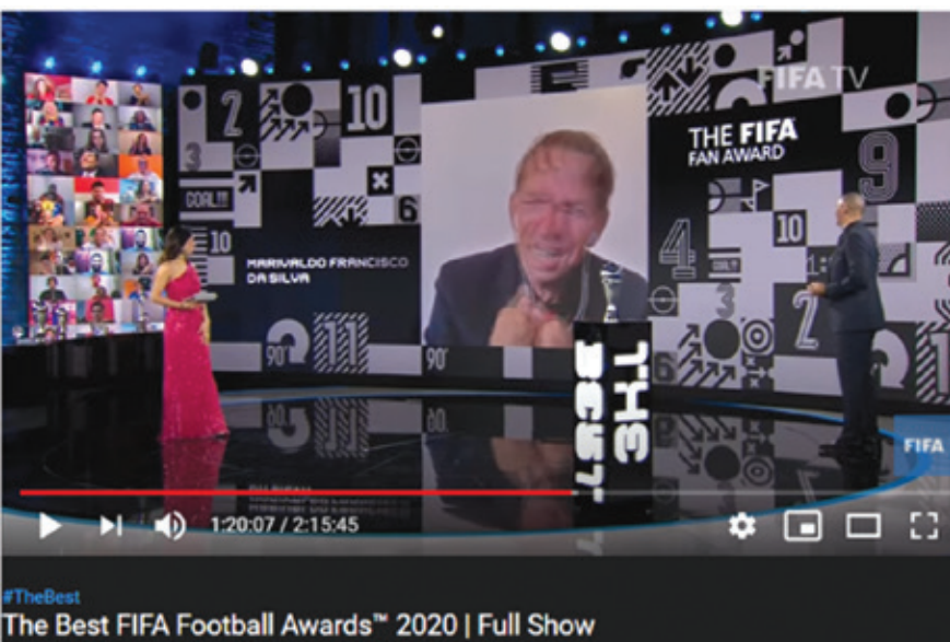
Rys. 2. Zamazany i niesłyszany laureat The Best FIFA Football Awards 2020

IP) jest praktycznie niewyczerpalna i można oprzeć działanie całego systemu na unikatowości tych identyfikatorów;