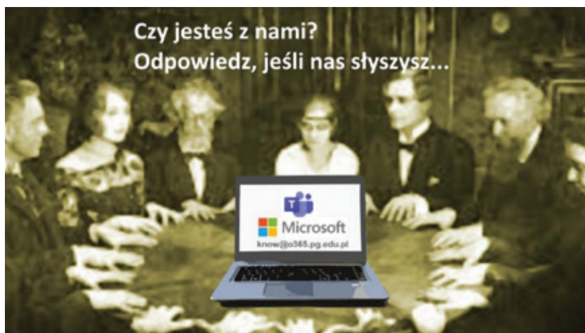
Rys. 1. Na spotkaniu z... zaświatami?

Popularna definicja określa Internet jako sieć sieci. Wszystkie dane są transportowane w pewnych zunifikowanych porcjach – pakietach IP. Jeżeli chcemy przesłać dużą ilość danych, to dzielimy je na porcje i przesyłamy każdą z nich, często inną trasą, z osobną (nazywamy to komutacją pakietów). Sieci wchodzące w skład Internetu mogą być różne (przewodowe albo bezprzewodowe; lokalne albo rozległe; przenoszące dane w ramach, pakietach, komórkach, blokach itd.). Istotne jest, aby potrafiły przenosić pakiety IP (wewnątrz ramek, pakietów, komórek, bloków itd.). Projektanci Internetu zaproponowali rozdzielanie funkcji transportowych (przesyłania danych) od funkcji usługowych – tzw. zasada end-to-end . Sprowadza się to do budowania „głupiego” rdzenia sieciowego i podłączonych do niego „mądrych” urządzeń realizujących usługi (patrz rys. 3). Ich wspólną cechą jest umiejętność dogadywania się w określonym języku protokołów TCP/IP, stanowiących zestaw uzgodnień, według których łączą się sieci [nazwę przyjęto od dwóch głównych protokołów: IP ( Internet Protocol ) i TCP ( Transmission Control Protocol )].