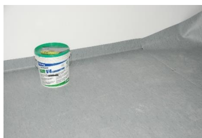
Rys. 1. System antyelektrostatyczny oparty na wykładzinie ESD: a) podkład betonowy z widoczną instalacją uziemiającą, b) warstwa wierzchnia z wykładziny ESD

Systemy oparte na wykładzinach ESD montowane są na uprzednio wykonanych podkładach betonowych (Rys. 1). Do grupy tej możemy zaliczyć dwuwarstwowe wykładziny podłogowe PCV, kauczukowe i dywanowe oraz maty podłogowe. Typowe wykładziny PCV posiadają grubość ~2 mm, natomiast wykładziny kauczukowe od 2 mm do 4 mm. Wierzchnia warstwa wykładziny posiada właściwości elektrostatycznie rozpraszające, a przewodzący spód zapewnia skuteczne odprowadzanie ładunków do uziemienia. Podłogowe maty ESD posiadają zatrzaski do podłączenia uziemienia oraz zaokrąglone narożniki. Maty podłogowe mogą być również uziemiane są przy pomocy samoprzylepnej taśmy aluminiowej lub za pośrednictwem specjalistycznych klejów. Antyelektrostatyczne wykładziny dywanowe zapewniają skuteczne odprowadzanie ładunków elektrostatycznych z personelu wyposażonego w obuwie ESD. Rozwiązania tego typu stosuje się często w laboratoriach i biurach objętych ochroną przed ESD. Wykładziny te, charakteryzujące się wysoką estetyką, wykonane są najczęściej z poliamidu z dodatkiem włókna przewodzącego i wymagają przy układaniu użycia kleju przewodzącego oraz specjalnych środków do przygotowania podłoża. Najnowszym rozwiązaniem z tego sektora są prefabrykowane antyelektrostatyczne systemy podłogowe dostarczane w formie przypominającej puzzle, stosowane np. do tworzenia tymczasowych stref EPA (z ang. Environmental Protection Area ) – obszarów chroniących przed elektrostatycznością statyczną ESD.