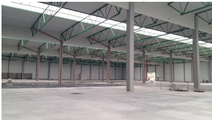
Rys. 3. Widok posadzki antyelektrostatycznej betonowej DST

przewodność posadzki. W celu odprowadzenia ładunków elektryczności statycznej płytę posadzkową łączy się z instalacją uziemiającą. Podczas wykonywania płyty posadzkowej na jej górną powierzchnię rozsypywany jest utwardzacz posadzkowy o właściwościach przewodzących, a całość zacierana mechanicznie przy użyciu zacieraczek. Na zatartą powierzchnię natryskiwany jest preparat pielęgnujący, a zarazem impregnujący nawierzchnię. Kolejnym etapem wykonania posadzki jest nacięcie i wypełnienie szczelin skurczowych oraz szwów roboczych, jeżeli takie zostały zaprojektowane. Posadzki betonowe utwardzane powierzchniowo w większości wykonywane są w klasie posadzek przewodzących o rezystancji elektrycznej na poziomie R_u < 1 \cdot 10^5 \Omega .