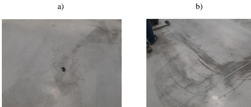
Rys. 7. Widok odspojenia warstwy z suchej posypki utwardzającej DST od podkładu betonowego

Jako rozwiązanie zaistniałego problemu zaproponowano usunięcie zdegradowanych warstw wierzchnich oraz dalszą diagnostykę pod kątem osiągnięcia parametrów wytrzymałościowo-eksploatacyjnych przez płytę konstrukcyjną. Z uwagi na terminy oddania obiektu do eksploatacji podjęto decyzję o dosączeniu podkładu betonowego żywicą głębokopenetracją, a następnie wykonaniu wierzchnich warstw wykończeniowych w postaci żywicy.