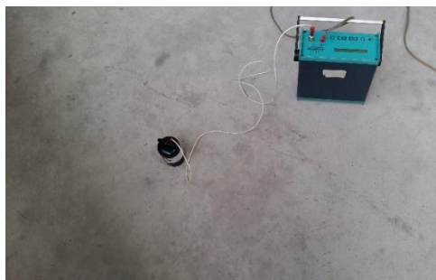
Rys. 4. Pomiar rezystancji upływu R_u [ \Omega ] posadzki antyelektrostatycznej przy użyciu przyrządu pomiarowego Tera-Ohm-Meter 6206 (prod. Eltex) oraz elektrody pomiarowej o nacisku F=25\text{N}

Pomiar rezystancji upływu R_u < 1 \cdot 10^5 \Omega dokonywany jest przy napięciu pomiarowym 10 V, a pomiar rezystancji R_u \geq 1 \cdot 10^5 \Omega przy napięciu pomiarowym 100 V. Odpowiedni dobór napięcia pomiarowego zapewnia prawidłowy pomiar rezystancji. Inne napięcia powodują zafałszowanie wyników pomiarowych.