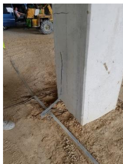
Rys. 5. Instalacja uziemiająca rozmieszczona na górnej powierzchni podbudowy

Posadzka pływająca o grubości 22 cm zaprojektowana została z betonu C25/30 XC2 na podobudowie górnej w postaci stabilizacji R_m=2,5 MPa o grubości 20 cm. Posadzka zaprojektowana została jako zbrojona włóknami stalowymi wraz z lokalnymi dozbrojeniami. Dokumentacja projektowa przewidywała wykonanie posadzki betonowej antyelektrostatycznej monolitycznej w technologii Bautech Antistatic DST System [32] wraz z montażem instalacji uziemiającej w płycie konstrukcyjnej.