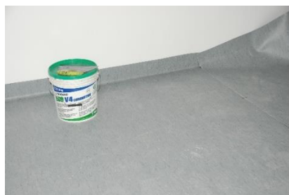
Rys. 1. System antyelektrostatyczny oparty na wykładzinie ESD: a) podkład betonowy z widoczną instalacją uziemiającą, b) warstwa wierzchnia z wykładziny ESD

Systemy oparte na wykładzinach ESD montowane są na uprzednio wykonanych podkładach betonowych (Rys. 1). Do grupy tej możemy zaliczyć dwuwarstwowe wykładziny podłogowe PCV, kauczukowe i dywanowe oraz maty podłogowe. Typowe wykładziny PCV posiadają grubość ~2 mm, natomiast wykładziny kauczukowe od 2 mm do 4 mm. Wierzchnia warstwa wykładziny posiada właściwości elektrostatycznie rozpraszające, a przewodzący spód zapewnia skuteczne odprowadzanie ładunków do uziemienia. Podłogowe maty ESD posiadają zatrzaski do podłączenia uziemienia oraz zaokrąglone narożniki. Maty podłogowe mogą być również uziemiane przy pomocy samoprzylepnej taśmy aluminiowej lub za pośrednictwem specjalistycznych klejów. Antyelektrostatyczne wykładziny dywanowe zapewniają skuteczne odprowadzanie ładunków elektrostatycznych z personelu wyposażonego w obuwie ESD. Rozwiązania tego typu stosuje się często w laboratoriach i biurach objętych ochroną przed ESD. Wykładziny te, charakteryzujące się wysoką estetyką, wykonane są najczęściej z poliamidu z dodatkiem włókna przewodzącego i wymagają przy układaniu użycia kleju przewodzącego oraz specjalnych środków do przygotowania podłoża. Najnowszym rozwiązaniem z tego sektora są prefabrykowane antyelektrostatyczne systemy podłogowe dostarczane w formie przypominającej puzzle, stosowane np. do tworzenia tymczasowych stref EPA (z ang. Environmental Protection Area ) – obszarów chroniących przed elektrostatycznością statyczną ESD.