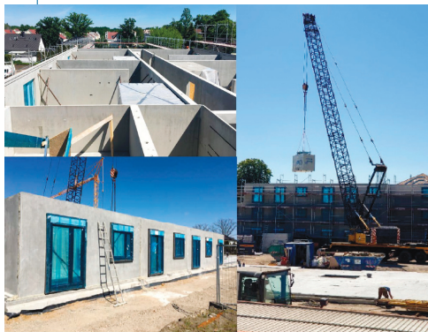
Fot. 1. Budowa budynków mieszkalnych z prefabrykatów modułowych w Berlinie

Odpowiadając na te zmiany i potrzeby rynku europejskiego, wiele zakładów prefabrykacji betonowej opracowuje nowe rozwiązania systemowe do budownictwa mieszkaniowego, które pozwolą na przyspieszenie realizacji inwestycji (fotografia 1). Ogromną za-