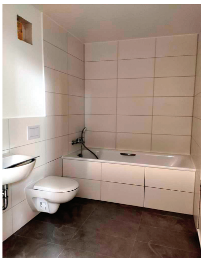
Fot. 3. Wykończona prefabrykowana łazienka GOLDBECK Comfort

Analiza kosztów wykazuje, że w budownictwie mieszkaniowym najbardziej czasochłonnym i kosztownym etapem jest wykończenie węzłów sanitarnych. W związku z tym firma GOLDBECK Comfort na początku 2020 r. wprowadziła do sprzedaży łazienki prefabrykowane z pełnym wykończeniem wnętrza (fotografia 3).