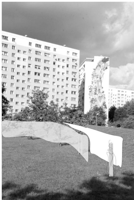
Fig. 3. Sketch to the 'shelter' project prepared for the 'Images Painted with Fire' Artistic Festival scheduled for October 2016 in the Zaspá district of Gdańsk. Source: illustration by A. Kurkowska

Ryc. 3. Szkic do projektu 'schronienie' przygotowany na Festiwal Artystyczny 'Obrazy Ogniem Malowane' planowany na październik 2016 w gdańskiej dzielnicy Zaspá. Źródło: il. A. Kurkowska