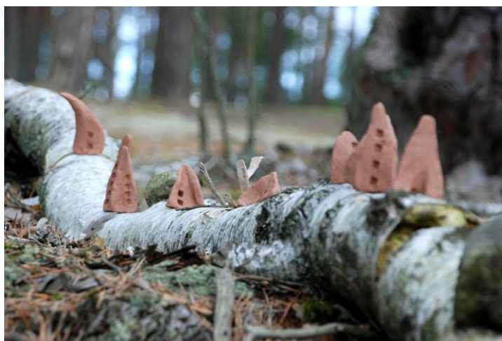
Fig. 5. Forms in the plein-air layout, prepared for the Images Painted with Fire Festival, Joniny Wielkie, the commune of Karsin 2016. Source: photo by A. Kurkowska

Ryc. 5. Formy w aranżacji plenerowej przygotowane na Festiwal OOM, Joniny Wielkie, gm. Karsin 2016. Źródło: fot. A. Kurkowska.