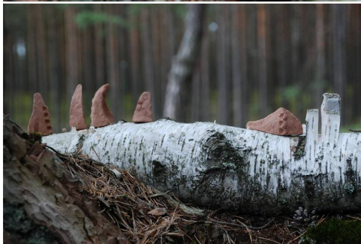
Fig. 6. Forms in the plein-air layout, prepared for the Images Painted with Fire Festival, Joniny Wielkie, the commune of Karsin 2016.

Ryc. 5. Formy w aranżacji plenerowej przygotowane na Festiwal OOM, Joniny Wielkie, gm. Karsin 2016.