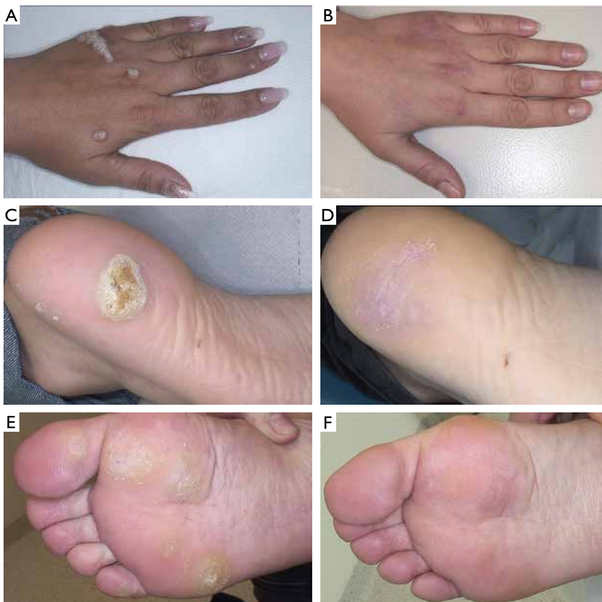
Figure 1. Clinical effects of treatment with intralesionally administered bleomycin in selected 3 patients with treatment-refractory viral warts in different anatomical locations. A – A 30-year-old female with resistant viral warts on the left hand previously treated unsuccessfully for 36 months in another clinic with cryotherapy (20 cycles) and different topical formulations (salicylic acid, 5-fluorouracil + salicylic acid, monochloroacetic acid); B – complete resolution of all lesions ( n = 13 ; not all visible in the figure) was observed after 10 courses of bleomycin treatment; C – a 19-year-old male with a resistant viral wart on the left heel previously treated unsuccessfully for 18 months in another clinic with cryotherapy (10 cycles) and salicylic acid; D – complete resolution of the lesion was observed after 7 courses of bleomycin treatment; E – a 32-year-old female with resistant viral warts on the anterior part of the right foot previously treated unsuccessfully for 12 months in another clinic with cryotherapy (10 cycles) and salicylic acid; F – complete resolution of all lesions was observed after 3 courses of bleomycin treatment

obserwowano żadnych ciężkich zdarzeń niepożądanych, które wymagałyby przerwania leczenia. Nie stwierdzono także objawów ogólnoustrojowych