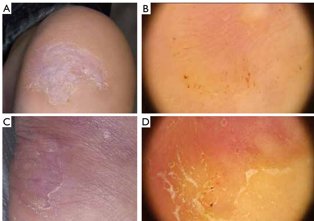
Figure 3. Dermoscopy allows for more precise patient assessment and facilitates therapeutic decision. A, C – 2 patients in whom based on clinical presentation complete resolution of viral warts was suspected. B, D – Dermoscopy showed remnants of the lesions at the periphery manifesting with a presence of pinkish and reddish dots and white-yellowish scaling

Rycina 3. Dermoskopia umożliwia dokładniejszą ocenę pacjenta i ułatwia podejmowanie decyzji terapeutycznych. A, C – 2 pacjentów, u których na podstawie obrazu klinicznego podejrzewano całkowite ustąpienie brodawek wirusowych. B, D – W obrazie dermoskopowym uwidoczniono jednak pozostałości zmian na obwodzie, w postaci różowawych i czerwonych kropek oraz biało-żółtawej łuski