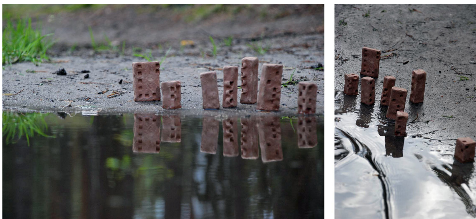
Ryc. 10. Badanie przestrzeni granicznych I Źródło: opracowanie własne.

Jako przykład eksploracji badawczo-twórczych przestrzeni granicznych można podać sprawdzanie lokowania na brzegu zbiornika wodnego, a nawet na skraju kałuży w lesie powstałej w wyniku obfitych opadów (ryc. 10–11).