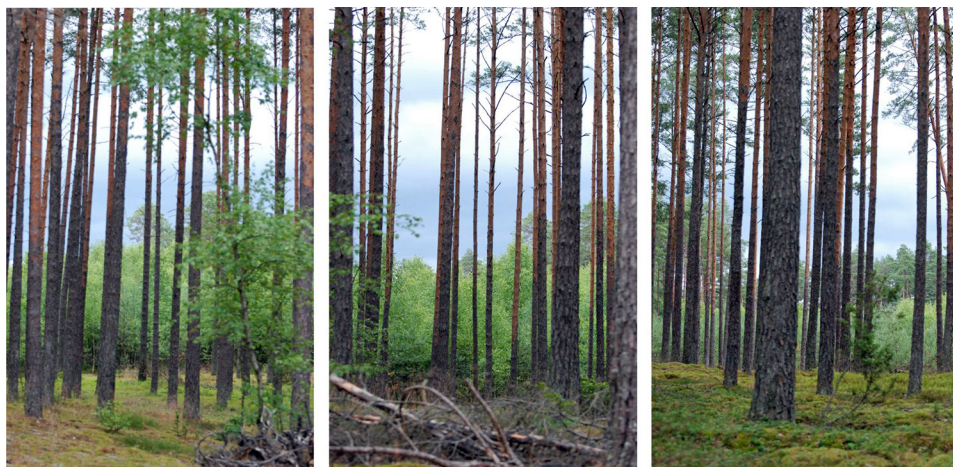
Ryc. 2. Wybrany przykład fotografii z kadrami krajobrazowymi – element analizy, Przymarkowa 2020

Wszystkie podjęte wątki przyniosły efekt spasowania i pozwoliły odkryć przebieg układów geometrycznych. Zauważono też duże podobieństwo w przebiegu tych śladów w różnych skalach. Fotografie z kadrami krajobrazowymi i malarskie próby plenerowe wyłoniły linie analogiczne do obserwowanych w poszyciu (ryc. 2–3). Wynika to zapewne po części z ogólnych praw fizyki i poruszania się w tej samej strefie klimatycznej (wpływ wiatru, mrozu, słońca) i geograficznej (budowa geologiczna, struktura gleby), ale pozwala pomyśleć o stworzeniu klasyfikacji tych sytuacji. Pojedyncze wzniesienia czy nakładające się ich serie mają przecież