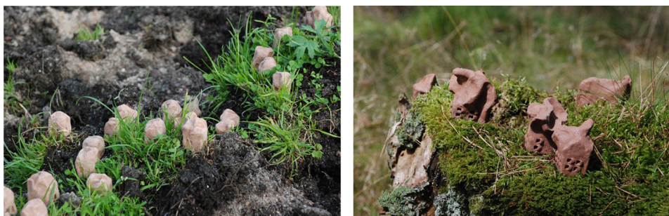
Ryc. 14. Wybrane przykłady według klasyfikacji pod kątem zindywidualizowania formy obiektów rzeźbiarskich (kolejno: typ „A”, typ „B”)

Drugi podział uwzględnia różne podejścia twórcze w metodzie. Można więc podzielić dotychczasowe efekty na dwie grupy: rozwiązania uzyskane poprzez formy schematyczne i te, w których zespół form to grupa rzeźb nieidentycznych, o unikalnym kształcie, ale stanowiących zbiór o jednorodnym charakterze formalnym (ryc. 14).