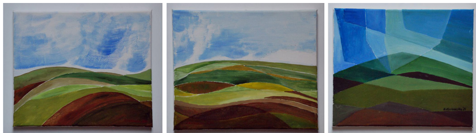
Ryc. 3. Wybrany przykład malarstwa plenerowego – element analizy, Joniny Wielkie 2020