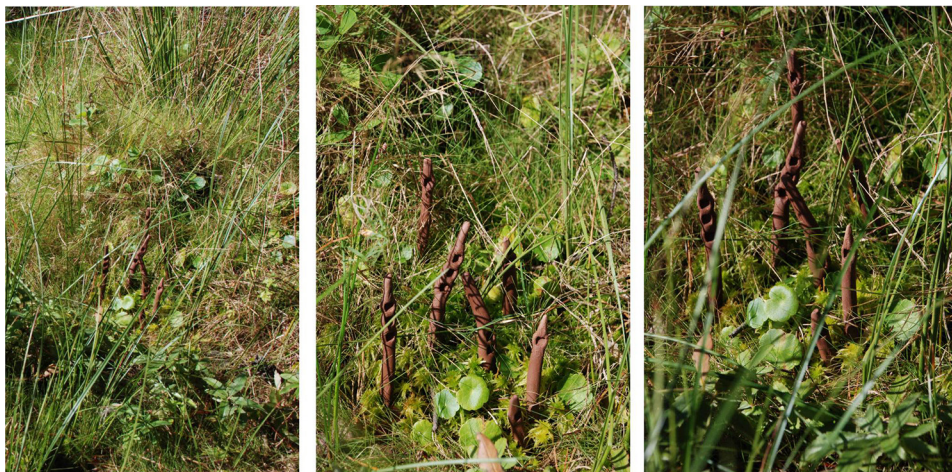
Ryc. 9. Wtopienie w otoczenie III