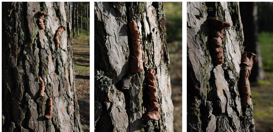
Ryc. 8. Wtopienie w otoczenie II

Wtopienie w otoczenie można realizować także poprzez upodobnienie form wprowadzanych do tych istniejących w przyrodzie, takich jak np. rośliny (żywe lub ich pozostałości), kamienie, gleba (ryc. 7–9). Podobieństwo wizualne pozwala na odbieraną wzrokowo asymilację. Działanie to wywiedzione jest ze zjawiska mimikry i dość powszechnie stosowane w obrębie bioniki. W tym projekcie, którego celem jest poszukiwanie sposobów i metod spasowania, sprawdziło się bardzo dobrze jako jeden z tropów.