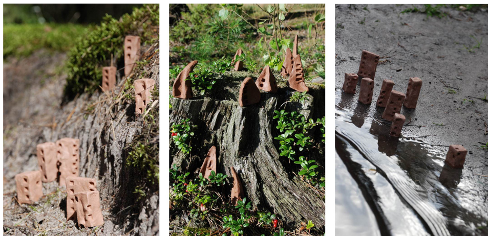
Ryc. 4. Wybrane przykłady według kategorii tematycznych, kolejno: podążanie za topografią, wtopienie w otoczenie czy badanie przestrzeni granicznych

w otoczenie czy badanie przestrzeni granicznych. Kategoryzacja tematyczna wydaje się obrazować najlepiej problem stawiany przed narzędziem wspierającym poszukiwanie układów obiektów architektonicznych zgodnych z uwarunkowaniami przyrodniczymi Pojezierza Kaszubskiego.