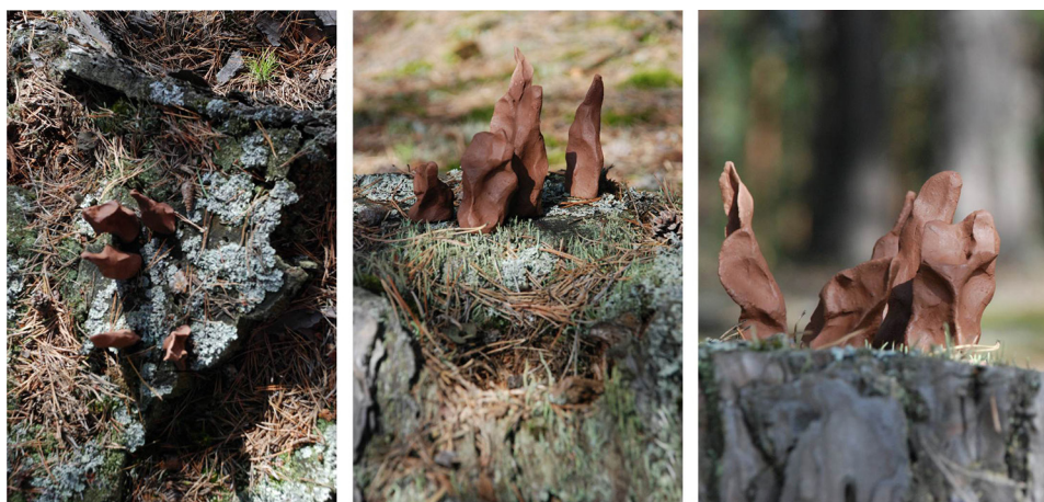
Ryc. 12. Rekompozycja z elementami biomorficznymi I

Osobny zbiór tworzą działania z elementami biomorficznymi przekomponowanymi zastane miejsca w oparciu o analogie bioniczne (ryc. 12–13). Użyte w aranżacji formy powstały jako efekt autonomicznych refleksji na temat formy dopasowanej do przyrody zastanej. Efemeryczne obiekty nawiązują do kształtów. Powtarzają kierunki zastane, powielają zaobserwowane relacje formalne. Z takimi konotacjami wracają do miejsc składających się na zbiór doświadczeń twórcy.