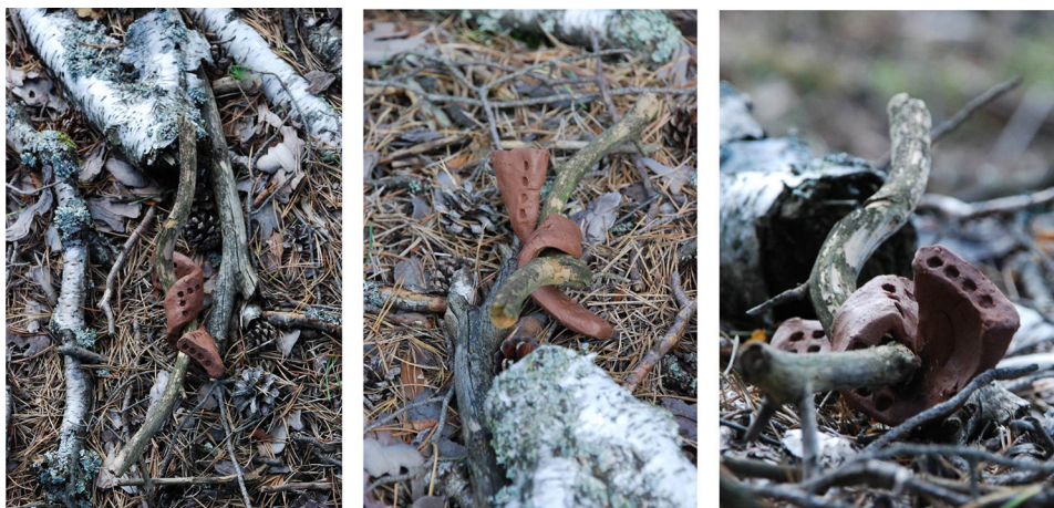
Ryc. 13. Rekompozycja z elementami biomorficznymi II

Autorskie rzeźby poszukują powinowactwa i źródła. Ukazują spasowanie, ale też niosą własną treść. Uzupełnione o przesłanie autorskie wnoszą wartości kulturowe, zmieniają wyraz i nastrój miejsca.