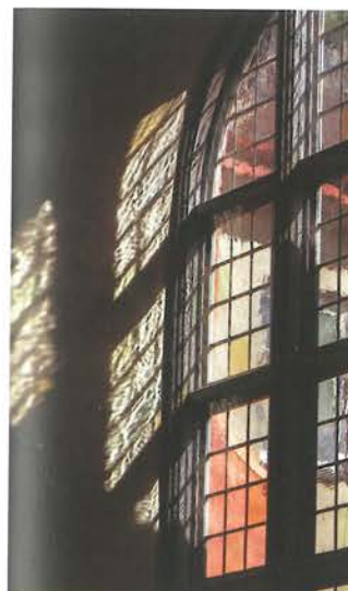
12. Barczewo. Kaplica Świętego Antoniego. Zrekonstruowane barokowe okna, 2022.

W kaplicy przywrócono okna barokowe z lat 40. XVII wieku, czyli etapu rozbudowy wcześniejszej manierystycznej kaplicy centralnej. Podczas prac usunięto XIX-wieczne zamurowanie z cegły maszynowej i odsłonięto barokowe ościeża oraz zrekonstruowano półkolisty wykrój okna. Forma ościeży i ślady w tynku świadczyły, że były to okna o masywnej drewnianej ościeżnicy, osadzonej przy licu zewnętrznym muru. W tym okresie historycznym okna miały grube słupki konstrukcyjne i poprzeczne ślemiona, tworzące podział na niewielkie kwatery. Wielkość kwater uzależniona była od technologii wytwarzania szkła. Możliwe do wykonania okazały się jedynie małe szybki, które – osadzone w gęstej siatce listew ołowianych – tworzyły ciężką błonę, uginającą się pod własnym ciężarem przy zbyt dużej rozpiętości.