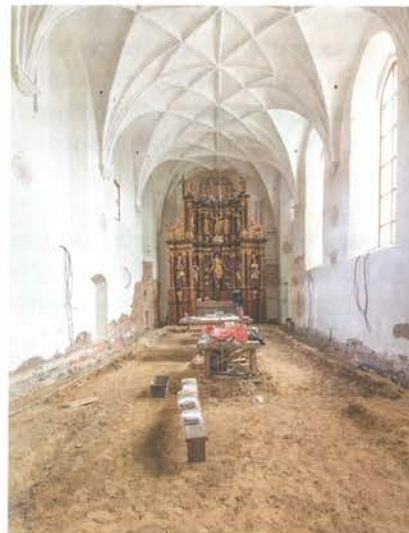
13. Barczewo. Kościół Świętego Andrzeja. Prezbiterium w trakcie prac konserwatorskich, 2021.