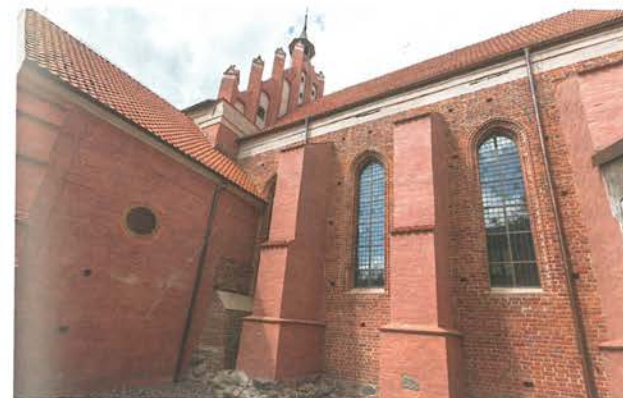
11. Barczewo. Kościół Świętego Andrzeja. Widok elewacji południowej prezbiterium, stan po ukończeniu prac konserwatorskich, 2022.

Więcej śladów pozostało do naszych czasów po oknach późniejszych – z końca XVII wieku – i ten etap został odtworzony podczas prac konserwatorskich. Odnaleziono mianowicie fragmenty środkowego drewnianego słupka, w nadmurowanych parapetach trzech okien. Oprócz tego w zastygłym tynku odcisnięty był negatyw XVII-wiecznej drewnianej ramy okiennej, w której mocowano błonę oszklenia. Według odnalezionych relikwów odtworzono kształt