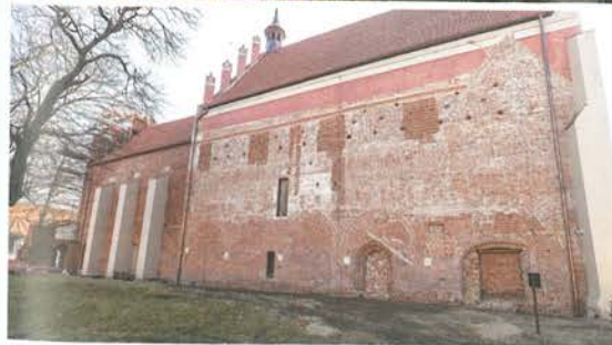
6. Barczewo. Kościół Świętego Andrzeja. Elewacja północna będąca świadectwem skomplikowanej historii architektonicznej klasztoru i kościoła, stan po konserwacji w 2022 roku.