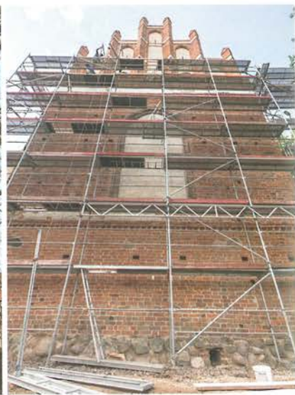
8. Barczewo. Kościół Świętego Andrzeja. Elewacja wschodnia w trakcie prac konserwatorskich, podczas rekonstrukcji zwieńczenia szczytu, 2022 roku.

średniowiecznych miasta. Od zewnętrznej strony mur został zwieńczony fryzem z ząbkowaniem i pasem tynku zapewne dodatkowo dekorowanym malowanym ornamentem. Powyżej znajdowały się blanki.