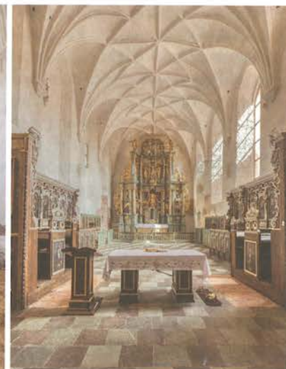
14. Barczewo. Kościół Świętego Andrzeja. Prezbiterium po zakończeniu prac konserwatorskich, 2022.