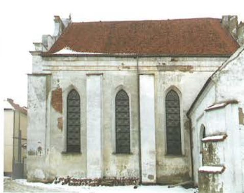
9. Barczewo. Kościół Świętego Andrzeja. Elewacja południowa korpusu, w całości pokryta cementowym tynkiem, stan przed rozpoczęciem prac konserwatorskich w 2018 roku.

Elewacja południowa w średniowieczu i epoce nowożytnej wychodziła na ogród należący do zakonników. To w niej znajdowały się okna doświetlające wnętrze kościoła.