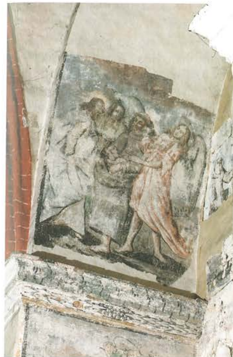
19. Barczewo. Kościół Świętego Andrzeja, kaplica Świętego Franciszka. Odsłonięta w trakcie prac dekoracja malarska ściany północnej korpusu nawowego w arkadzie bocznej kaplicy, związana z istnieniem bractwa tercjarskiego. Scena „Święty Franciszek w drodze do Porcjunkuli w towarzystwie aniołów”.

Pierwszy nowożytny ołtarz pod wezwaniem świętego Franciszka z Asyżu w kościele Bernardynów w Barczewie konsekrowano w 1656 roku. Jego wygląd nie jest dzisiaj znany. Do naszych czasów zachował się jedynie umieszczony w późniejszej nastawie obraz przedstawiający stygmatyzację świętego Franciszka oraz polichromia namalowana na ścianie i filarach wokół ołtarza.