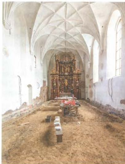
13. Barczewo. Kościół Świętego Andrzeja. Prezbiterium w trakcie prac konserwatorskich, 2021.