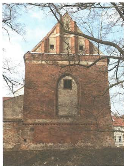
7. Barczewo. Kościół Świętego Andrzeja. Elewacja wschodnia, stan przed rozpoczęciem prac konserwatorskich w 2018 roku.

Elewacja wschodnia mimo swojego gotyckiego wyrazu nie jest jednolita. Jej najstarszy fragment stanowi relikw muru obronnego Barczewa zawierający się w jej dolnej części, wzniesiony przez biskupa Henryka Sorboma w czwartej ćwierci XIV wieku. Jest to jedyny tak dobrze zachowany fragment fortyfikacji