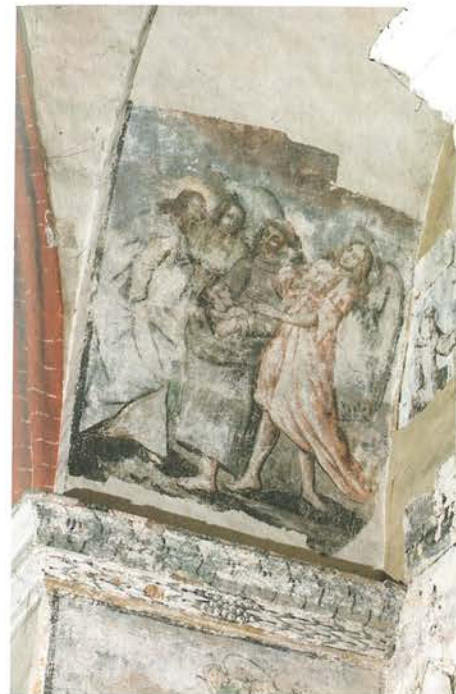
19. Barczewo. Kościół Świętego Andrzeja, kaplica Świętego Franciszka. Odsłonięta w trakcie prac dekoracja malarska ściany północnej korpusu nawowego w arkadzie bocznej kaplicy, związana z istnieniem bractwa tercjarskiego.

Pierwszy nowożytny ołtarz pod wezwaniem świętego Franciszka z Asyżu w kościele Bernardynów w Barczewie konsekrowano w 1656 roku. Jego wygląd nie jest dzisiaj znany. Do naszych czasów zachował się jedynie umieszczony w późniejszej nastawie obraz przedstawiający stygmatyzację świętego Franciszka oraz polichromia namalowana na ścianie i filarach wokół ołtarza.