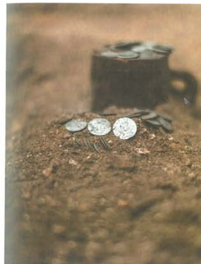
15. Barczewo. Kościół Świętego Andrzeja. Skarb składający się z 1084 sztuk srebrnych monet odnaleziony w trakcie demontażu posadzki z początku XVII wieku, pod stallami, kwiecień 2020.

Depozyt składał się z 1084 sztuk monet o łącznej wadze niemal kilograma. Większość to drobniejsze nominały monet polskich, pruskich, a także szwedzkich. Pochodzą głównie z mennic króla polskiego Zygmunta III (szelągi koronne i półtoraki) i księcia pruskiego Jerzego Wilhelma Hohenzollerna (szelągi). W dużo mniejszej liczbie wystąpiły grosze koronne, dwudenary litewskie i szelągi Gustawa II Adolfa. Najmłodsza z monet datowana jest na 1629 rok. Przyczyną tezauryzacji mogła być tzw. wojna pruska (1626–1635 ze słynnym epizodem bitwy oliwskiej), która bardzo silnie dotknęła Warmię. Prawdopodobnie są to indywidualne datki kościelne, a nie część dużego funduszu na