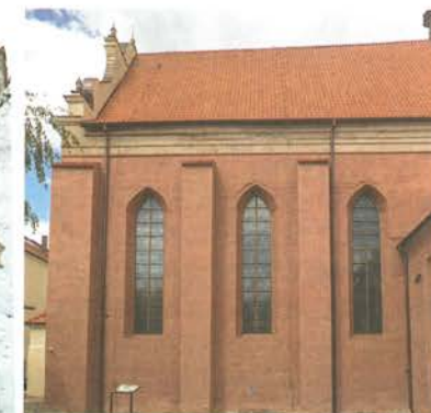
10. Barczewo. Kościół Świętego Andrzeja. Elewacja wschodnia, stan po konserwacji z rekonstrukcją kolorowych tynków, trzech dużych okien i sygnaturki, 2022 roku.

Elewacja nawy z okresu średniowiecza nie była tynkowana i zachowała się jedynie w partii przyziemia. Okna, mimo zamknięcia ich ostrołucznie, powstały dopiero na początku XVII wieku. Odbudowana wtedy świątynia została niemal w całości pokryta cienkim czerwonym tynkiem. Relikwy oryginalnej XVII-wiecznej wyprawy leżącej na licu cegieł można zobaczyć w wielu miejscach elewacji, gdyż zostały poddane konserwacji i pozostawione jako świadki.