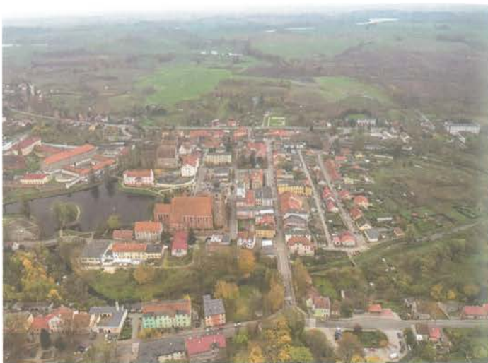
2. Barczewo. Widok z czytelnym układem architektonicznym miasta, z dominującą bryłą kościoła Świętej Anny, z kościołem Świętego Andrzeja w tle i znajdującym się na terenie dawnego folwarku franciszkańskiego zakładem penitencyjnym.

gdy resztę nieruchomości zajęło państwo. Mimo zabiegów Kościoła zabudowań nie przeznaczono na szkołę katolicką, ale przekazano ją na cele więzienia (w przeźroczu empory na pierwszym piętrze zamontowano wówczas solidne kraty, by więźniowie nie mogli uciec przez kościół). Fizyczne rozdzielanie zabudowań (zamurowanie przejść, przebudowa klasztoru na więzienie) nastąpiło w latach 1833–1836, chociaż początkowo użytkowano jeszcze zakrytą znajdującą się w skrzydle wschodnim klasztoru.