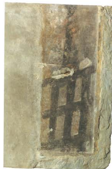
16. Barczewo. Kościół Świętego Andrzeja. Część odnalezionego w posadzce kamiennego ołtarza przegrodowego z 1626 roku, prawdopodobnie z polichromią przedstawiającą świętego Wawrzyńca trzymającego ruszt.