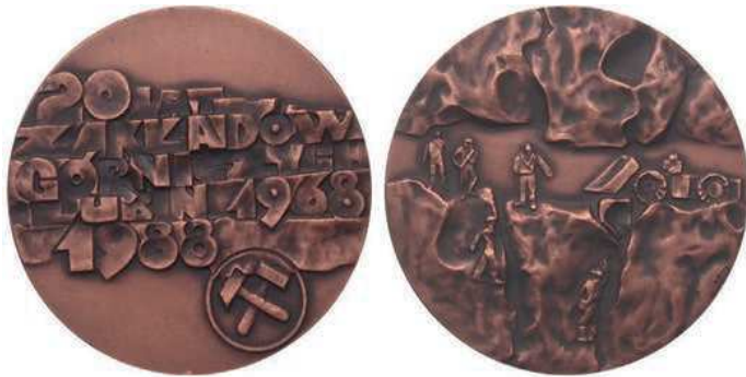
Rys. 28. Medal 20-lecia Zakładów Górniczych Lubin

Jubileusz 20-lecia Zakładów Górniczych Lubin upamiętnia medal z 1988 r. (rys. 28). Na awersie znajduje się stylizowany napis: 20 LAT / ZAKŁADÓW / GÓRNICZYCH / LUBIN 1968 / 1988. Poniżej po prawej stronie dwa skrzyżowane młotki górnicze w kółku. Na rewersie postacie górników w kopalni, z prawej strony ładowarka. Autorem projektu jest Hanna Jelonek. W nakładzie 1550 sztuk medal wybiła Mennica Państwowa (średnica 60 mm).