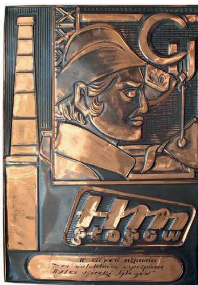
Rys. 52. Plaketka z podziękowaniem za pracę w Hucie Miedzi Głogów

Z podziękowaniem za pracę w Hucie Miedzi Głogów została wykonana plakieta z blachy miedzianej (rys. 52). Na plakiecie przedstawiono hutnika z profilem, u góry litery Cu, poniżej: HM Głogów. U dołu napis: W dowód uznania za wieloletnią współpracę Huta Miedzi „Głogów”. Wymiary plakiety to: 40x28,5 cm.