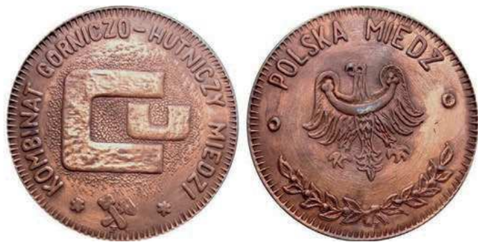
Rys. 12. Medal Polska Miedź z 1977 r.

Z 1977 r. pochodzi medal KGHM w Lubinie (rys. 12). Na awersie znajdują się stylizowane litery Cu, w otoku napis: KOMBINAT GÓRNICZO-HUTNICZY MIEDZI, u dołu są skrzyżowane młotki górnicze, tzw. kupła: pyrlik i żelazko, stanowiące symbol górnictwa. Na rewersie widnieje orzeł śląski, u góry przy krawędzi napis: POLSKA MIEDŹ. U dołu dwie splecione gałązki. Medal zaprojektował Eugeniusz Zygadło, wykonał Kazimierz Choroszy. Medal wykonano w miedzi (80 sztuk) i w srebrze (średnica 70 mm).