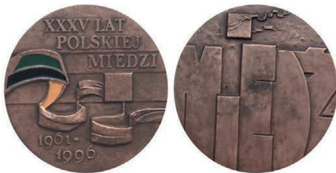
Rys. 15. Medal 35-lecia Polskiej Miedzi

Z 1996 r. pochodzi medal upamiętniający 35-lecie utworzenia Kombinat Górnico-Hutniczego Miedzi (rys. 15). Na awersie po obu stronach kwadratu jest falująca wstążka. Fragment został pokryty: zieloną, czarną i żółtą emalią. Zieleń i czerń symbolizują górnictwo, pomarańcz (na medalu błędnie kolor żółty) hutnictwo. W górnej części awersu napis: XXXV LAT / POLSKIEJ / MIEDZI. U dołu daty: 1961–1996. Na rewersie dużymi literami napis: MIEDŹ. U góry kostka z powiewającą wstęgą. Medal zaprojektowała i wykonała Hanna Jelonek (średnica 70 mm). W nakładzie 2000 sztuk wybiła go Mennica Państwowa.