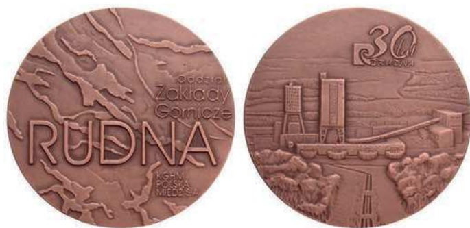
Rys. 37. Medal 30-lecia Zakładów Górniczych Rudna

W 2004 r. został wyemitowany medal z okazji 30-lecia Zakładów Górniczych Rudna (rys. 37). Na awersie na fakturowanej powierzchni znajdują się napisy: Oddział / Zakłady Górnicze / RUDNA / KGHM / POLSKA / MIEDŹ S.A. Na rewersie pokazano widok na kopalnię, powyżej logo kopalni i napis: 30 lat / RUDNA. Medal zaprojektował i wykonał Artur Bochniak, średnica to 70 mm. Został wybity w Mennicy Polskiej w nakładzie 1000 sztuk w miedzi patynowanej.