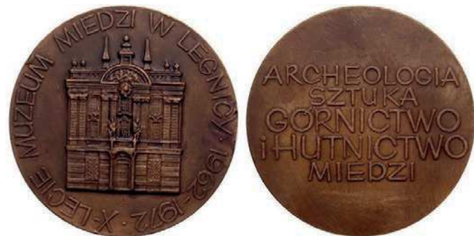
Rys. 2. Medal 10-lecia Muzeum Miedzi w Legnicy

Muzeum Miedzi w Legnicy wspólnie z Muzeum Azji i Pacyfiku w Warszawie zorganizowało wystawę „Miedź w kulturach Azji”. Była ona prezentowana w okresie od listopada 1985 r. do stycznia 1986 r. w Galerii Nusantara Muzeum Azji i Pacyfiku oraz w okresie styczeń – marzec 1986 r. w Muzeum Miedzi w Legnicy. Z okazji wystawy w 1985 r. został wyemitowany pamiątkowy medal (rys. 3). Na awersie przedstawiono siedzącego Budę, przed nim płonące kadzidło. Z lewej strony stylizowany napis: MIEDŹ / W KULTURACH / AZJI, z prawej daty: 1985 / 1986. Na rewersie siedzący mnich buddyjski. Przed nim naczynia. W otoku napis: MUZEUM MIEDZI – LEGNICA / MUZEUM AZJI I PACYFIKU – WARSZAWA. Autorem projektu jest Hanna Jelonek. Medal w nakładzie 250 sztuk w miedzi i 250 sztuk tombak patynowany wybiła Mennica Państwowa, średnica 69 mm.