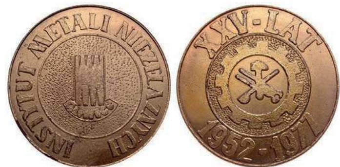
Rys. 65. Medal 25-lecia Instytutu Metali Nieżelaznych