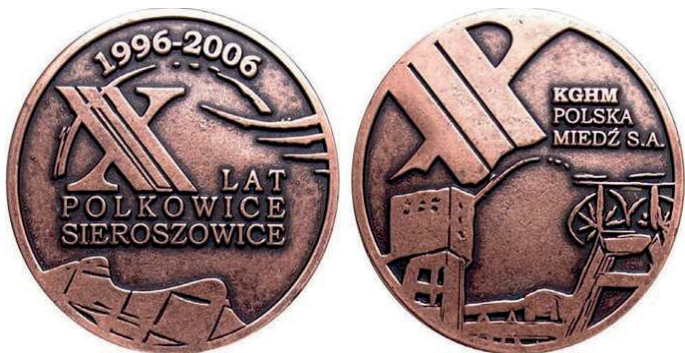
Rys. 44. Medal 10-lecia Zakładów Górniczych Polkowice-Sieroszowice

Mennica Państwowa w nakładzie 600 sztuk wybiła również medal z takim samym awersem i napisem na rewersie: JUBILEUSZ / 15-LECIA / ZAKŁADÓW GÓRNICZYCH / "SIEROSZOWICE". Z 2006 r. pochodzi medal 10-lecia Zakładów Górniczych Polkowice-Sieroszowice (rys. 44). Na awersie umieszczono napis: X LAT / POLKOWICE / SIEROSZOWICE, powyżej daty: 1996-2006. W dolnej części rewersu przedstawiono widok kopalni. Powyżej stylizowana liczba X i napis: KGHM / POLSKA / MIEDŹ S.A. Medal zaprojektował i wykonał Marian Ostrowski, Metaloplastyka Wrocław, wykonany z ołowiu miedziowanego, o średnicy 70 mm, w nakładzie 350 sztuk.