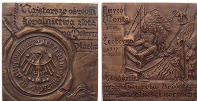
Rys. 5. Medal upamiętniający najstarsze ośrodki kopalnictwa na Dolnym Śląsku

Medal upamiętniający najstarsze ośrodki kopalnictwa na Dolnym Śląsku został wyemitowany w 1984 r. (rys. 5). Na awersie znajduje się pieczęć z napisem gotyckim: DE AUREO MONTE DECRETUM CIVITATIS. Wyżej napis: Najstarsze ośrodki / kopalnictwa złota / na Dolnym / Śląsku. Na rewersie widnieje postać stojącego nad rzeką władcy, obok szyb i górniczy. Po lewej napisy: Aureo / Monte / 1211 / Leoberga / 1217. Poniżej: Nadanie / przez Henryka Brodatego / prawa wolności górniczej. Wspomniane miasta to obecnie Złotoryja i Lwówek Śląski. Autorką projektu jest Hanna Jelonek. Medal wyemitowało Polskie Towarzystwo Archeologiczne i Numizmatyczne, Zarząd Oddziału Legnickiego w Lubinie. Wybiła go Mennica Państwowa w nakładzie: 150 sztuk w srebrze, 300 sztuk – tombak srebrzony i oksydowany, 450 sztuk – tombak patynowany, 450 sztuk – miedź oksydowana. Medal ma kształt kwadratu o wymiarach 65×65 mm.