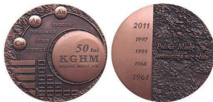
Rys. 19. Medal 50-lecia KGHM Polska Miedź S.A.

Również 50-lecie KGHM Polska Miedź S.A. zostało upamiętnione medalem (rys. 19). Na awersie w większym kole napis: 50 lat / KGHM / POLSKA MIEDŹ S.A., w mniejszych kołach symbole pierwiastków: Cu, Ag, Au. Na gładkiej powierzchni nazwy miast: GŁOGÓW, POLKOWICE, LUBIN, LEGNICA. Na rewersie z lewej strony na gładkiej powierzchni daty od dołu: 1961, 1968, 1991, 1997, 2011. Z prawej strony na fakturowanej powierzchni napis: Polska Miedź / cenniejsza niż złoto. Średnica medalu wynosi 70 mm.