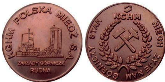
Rys. 40. Żeton Zakładów Górniczych Rudna

Również kolejne dwa żetony zostały wyemitowane przez Zakłady Górnicze Rudna. Na awersie pierwszego z nich (rys. 40) przedstawiono rysunek zabudowań kopalni, poniżej napis: ZAKŁADY GÓRNICZE / RUDNA, przy krawędzi: KGHM POLSKA MIEDŹ S.A., na rewersie skrzyżowane młotki górnicze otoczone splecionymi gałązkami, nad nimi logo i nazwę KGHM, w otoku: NIECH ŻYJE NAM GÓRNICZY STAN (średnica 28 mm).