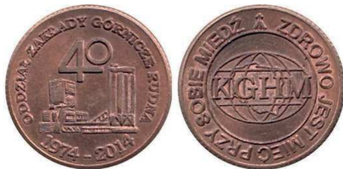
Rys. 39. Żeton 40-lecia Zakładów Górniczych Rudna

Z tej samej okazji 40-lecia Zakładów Górniczych Rudna został wykonany żeton (rys. 39). Na awersie umieszczono zabudowania kopalni, nad nimi liczbę 40, w otoku napis: ODDZIAŁ ZAKŁADY GÓRNICZE RUDNA / 1974–2014, na rewersie napis KGHM na tle kuli ziemskiej z obrysem granic Polski, w otoku natomiast: ZDROWO JEST MIEĆ PRZY SOBIE MIEDŹ.