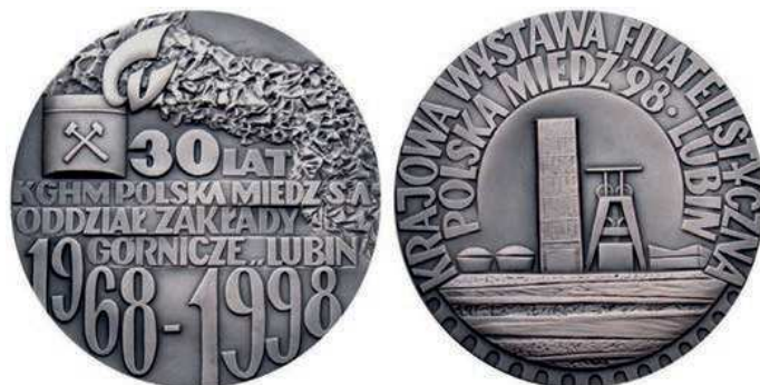
Rys. 29. Medal 30-lecia Oddziału Zakładów Górniczych Lubin

W 1998 r. Mennica Państwowa wybiła medal z okazji 30-lecia Oddziału Zakładów Górniczych Lubin (rys. 29). Na awersie napis: 30 LAT / KGHM POLSKA MIEDŹ S.A. / ODDZIAŁ ZAKŁADY / GÓRNICZE "LUBIN" / 1968–1998. U góry czapka górnicza z pióropuszem w kształcie liter Cu, obok nieregularny kształt jak ruda miedzi, na rewersie rysunek biurowca i wieży szybu kopalni, w górnej części dookoła w dwóch wierszach napis: KRAJOWA WYSTAWA FILATELISTYCZNA / POLSKA MIEDŹ'98. LUBIN (Wystawa Filatelistyczna towarzyszyła obchodom jubileuszu Zakładów Górniczych Lubin). W dolnej części przy krawędzi występuje ząbkowanie jak na znaczku pocztowym. Medal zaprojektowała Bożenna El-Sayed, wykonał Robert Kotowicz. Średnica 70 mm, wybit w tombaku srebrzonym i oksydowanym w nakładzie 755 sztuk.