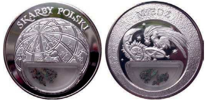
Rys. 1. Medal Miedź z serii Skarby Polski

W naturze czysta miedź jako miedź rodzima jest minerałem spotykanym rzadko, stanowiąc ok. 1% jej związków. Około 90% miedzi wchodzi w skład rud siarczkowych, a pozostałe 9% w skład tlenków metali. Większość miedzi pozyskiwana jest z minerałów kruszcowych, takich jak: chalkozyn, bornit, chalkopiryt, digenit, kowelin, kupryt, malachit, djurleit, anilit, idait [4]. Jeden z medali z serii Skarby Polski został poświęcony miedzi (rys. 1). Na awersie przedstawiono kulę ziemską z zaznaczonymi konturami Polski, na rewersie: słońce, księżyc, gwiazdy i wiatrowskaz. W dolnej części pojemnik z okruchami miedzi. Medal o średnicy 50 mm jest platerowany srebrem.