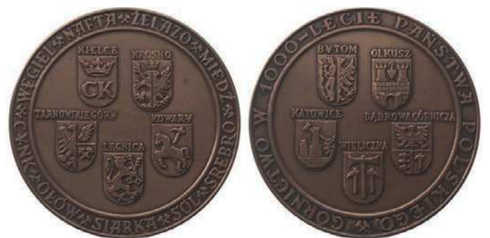
Rys. 4. Medal Górnictwo w 1000-lecie państwa polskiego

W 1000-LECIE PAŃSTWA POLSKIEGO. Medal zaprojektował i wykonał Wojciech Kubiczek. W tombaku w nakładzie 600 sztuk wybiła go Mennica Państwowa (średnica 70 mm).