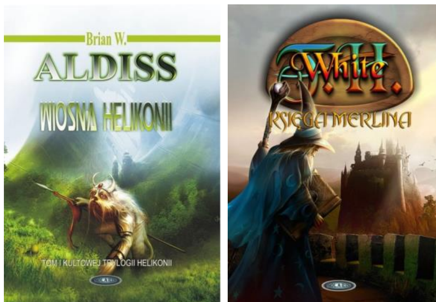
Ilustracja 1. Okładki z bohaterami fantastycznymi: Brian W. Aldiss, Wiosna Helikonii ; T.H. White, Księga Merlina [Wydawnictwo Solaris]