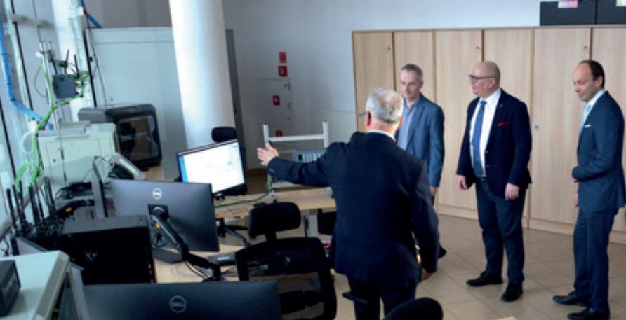
Fot. 4. Prezentacja stanowisk pomiarowych PL-5G

niki Gdańskiej dostępne są elementy systemów Internetu Rzeczy w postaci np. różnorodnych czujników czy elementów wykonawczych, stacji bazowych systemów IoT (np. LoRaWAN, Zig-Bee, NB-IoT, CAT-M, 5G), komputerów przemysłowych i zestawów rozwojowych, a także systemy Przemysłu 4.0 oferujące dedykowane dla rozwiązań przemysłowych systemy komunikacji (IWLAN), czujniki i zestawy sterowania wejść/wyjść klasy przemysłowej, pojazdy sterowane z czujnikami czy zestaw robotów kolaboracyjnych (por. fot. 5 i fot. 6).