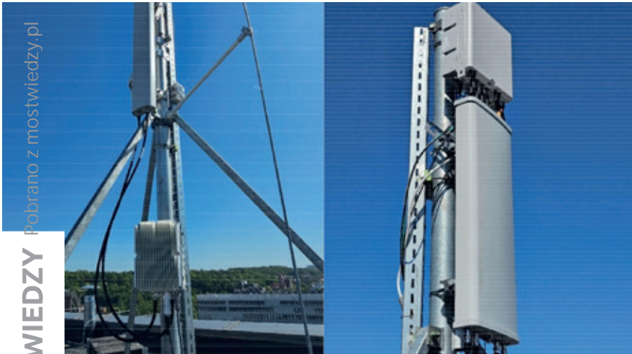
Fot. 3. Terenowy punkt instalacyjny – głowica radiowa 5G MIMO 2x2 z anteną obsługującą obszar południa Zatoki Gdańskiej oraz brama sieci LoRaWAN (po lewej); głowica radiowa 5G MIMO 4x4 oraz antena przeznaczona do pracy w paśmie n77 (po prawej)

W Laboratorium otoczenia 5G udostępniona została aparatura badawcza pozwalająca na weryfikację przypadków wykorzystania systemów i sieci 5G w różnorodnych scenariuszach ich pracy. W szczególności w laboratorium Politech-