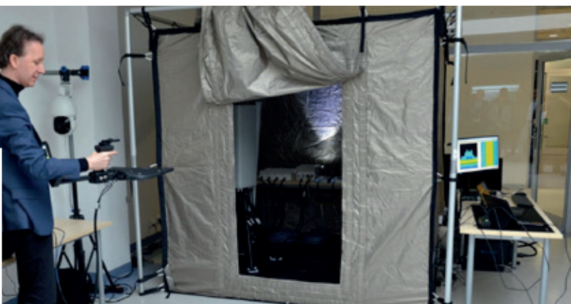
Fot. 1. Dr inż. Krzysztof Gierłowski przedstawia możliwości badań systemów RAN w zamkniętym środowisku propagacyjnym, jakim jest specjalizowany, ekranowany namiot