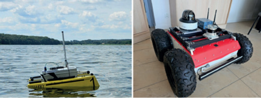
Fot. 6. Przykładowe pojazdy autonomiczne i sterowane na wyposażeniu Laboratorium otoczenia 5G: drony pływające, dron lądowy o dużym udźwigu wyposażony w lidar wielowiązkowy