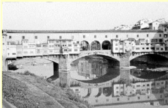
Florence – Ponte Vecchio

dziedzinie języków obcych i literatury. Pierwsze trzy kategorie pracowników akademickich posiadają tenure.