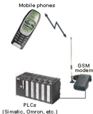
Rys. 1. Struktura systemu z telefonem odbierającym komunikaty ze sterownika PLC [9]

komórkowego można zastosować komputer z odpowiednim oprogramowaniem, połączony z modemem GSM.