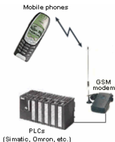
Rys. 1. Struktura systemu z telefonem odbierającym komunikaty ze sterownika PLC [9]

komórkowego można zastosować komputer z odpowiednim oprogramowaniem, połączony z modemem GSM.